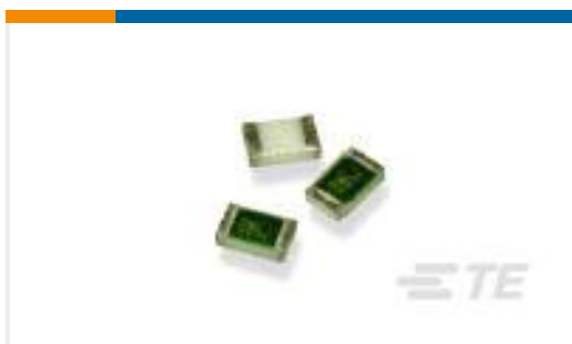
TE 产品编号8-1676481-6 CPF 0603 30K 0.1% 25PPM 1K RL