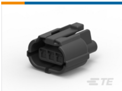
TE 产品编号2822366-1 .070 ECONOSEAL PLUG ASSY 3P