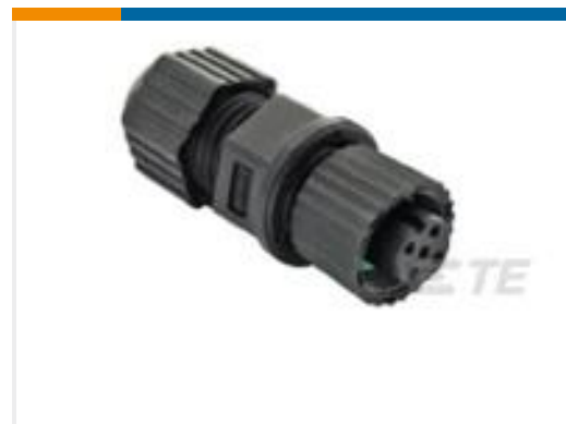
TE 产品编号1838274-3 M12 Fld Ser CONN. Female Skt S