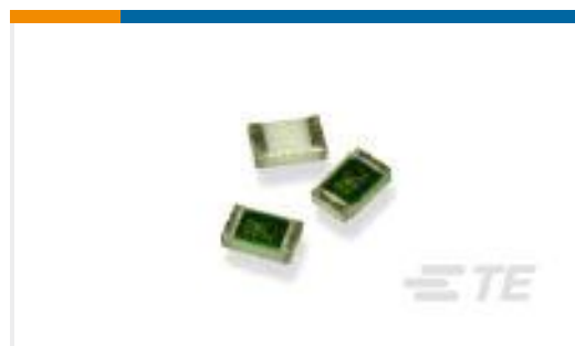
TE 产品编号9-1676481-6 CPF 0603 82K 0.1% 25PPM 1K RL