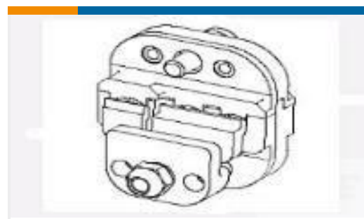
TE 产品编号2031676-2 SDE F MINI MIC 0.35-1.5mm2 DIE SET