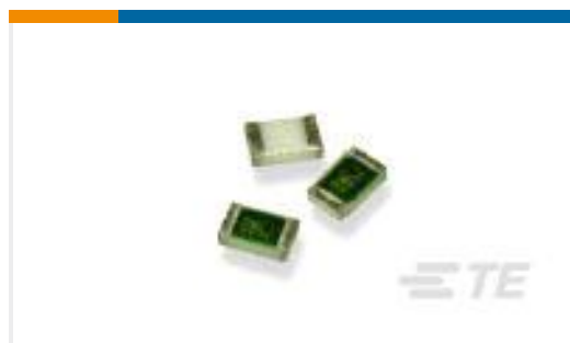
TE 产品编号9-1676481-0 CPF 0603 47K 0.1% 25PPM 1K RL