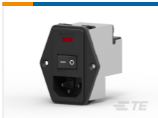
TE 产品编号1-6609103-1 PE0SXSH6B=C1258