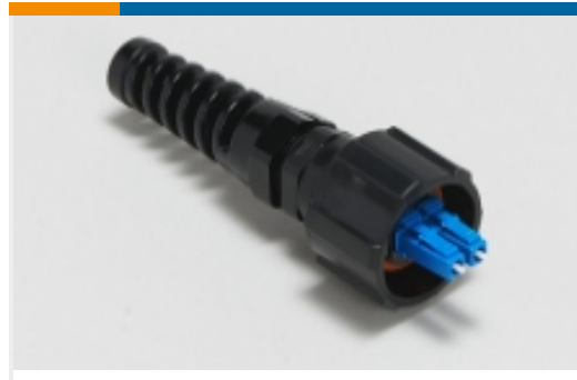
ODVA LC 连接器(3)