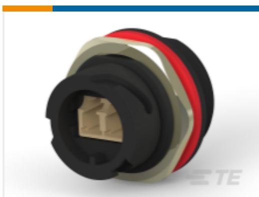
TE 产品编号 1828619-1 Kit,Receptacle,LC, ODVA,MM