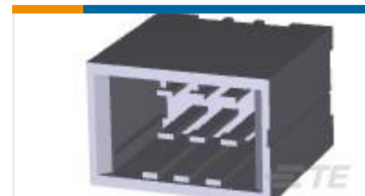
TE 产品编号178323-3 DYNAMIC D3100D HDR V 6P ASSY AU076