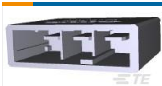
TE 产品编号1-353082-2 DYNAMIC D-5200 HDR V ASSY 3P