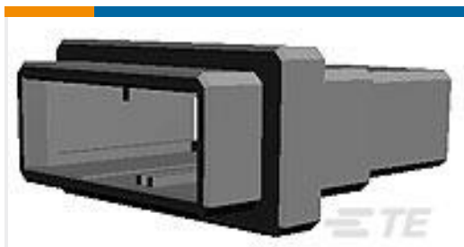
TE 产品编号1-1747414-3 DYNAMIC D4200 TAB HSG F/H 3P/X