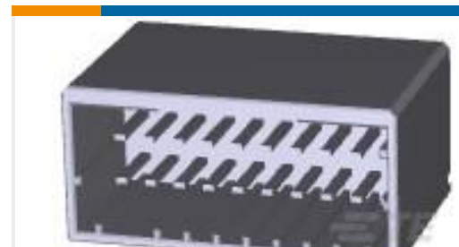
TE 产品编号1318127-1 DYNAMIC D2100 HDR V ASSY 20P