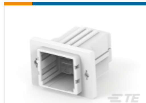
TE 产品编号3-917807-2 Dynamic 5000 母端和公端壳体