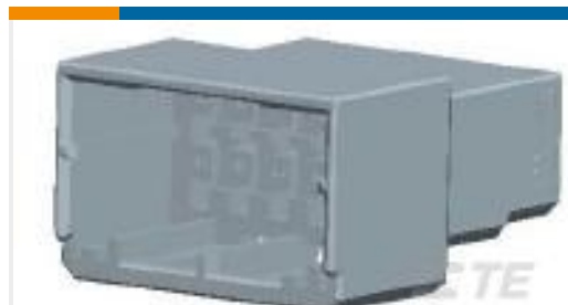
TE 产品编号1-1903130-6 DYNAMIC 1200D TAB HSG 12P F/H