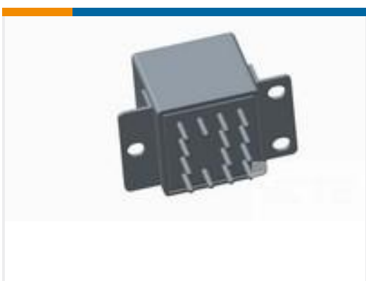
TE 产品编号2-1617805-4 TD228-3002P=TDFO 30 SEC M83726 /28-3002P