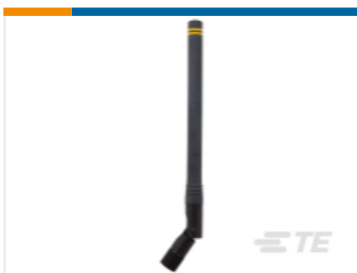
TE 产品编号ANT-916-CW-HWR-RPS Antenna 1/2 Wave Whip Swivel 916MHz RPS