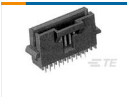
TE 产品编号5-104071-8 06 SYSTEM 50 HDR SRST SHRD SN