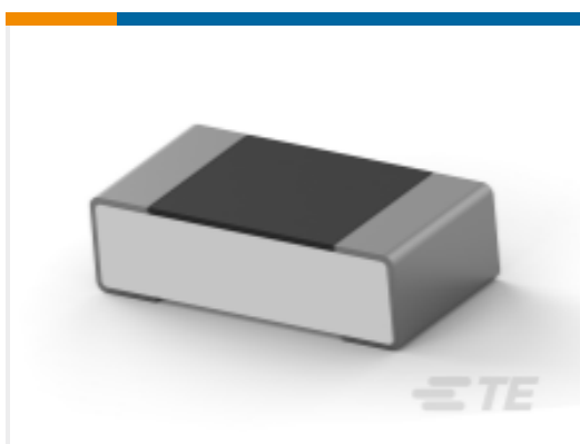
TE 产品编号1-2176369-8 RQ 0603 60R4 0.1% 10PPM 5K RL