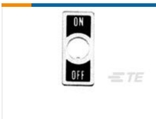
TE 产品编号2-1437628-4 SPA32=SW PLATE (ON-OFF) 1/4" D