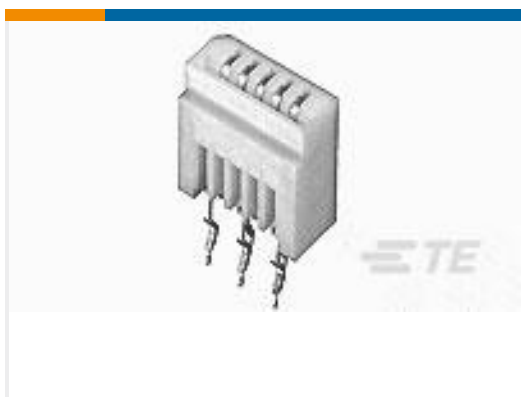
TE 产品编号84984-6 1mm FFC DIP V ASSY 6P NAT(TB)