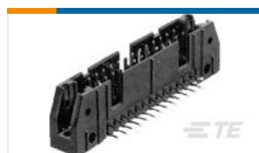
TE 产品编号5102162-8 A/L UNIV HDR 34P RA