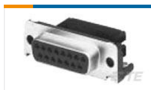
TE 产品编号5747813-4 15 MSFL RCPT RA 590L(IN,FM,BL)