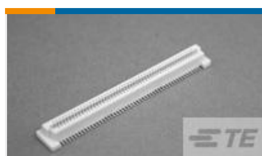
TE 产品编号1735481-4 0.8FH,R17H.5,100,08/Sn,TU,SC