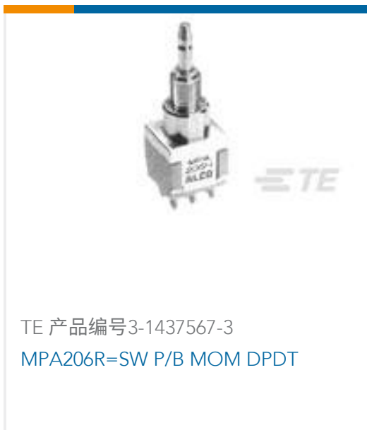
TE 产品编号3-1437567-3 MPA206R=SW P/B MOM DPDT