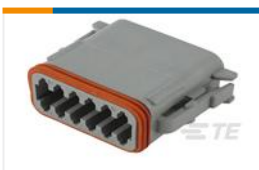
TE 产品编号DT06-12SA-C015 PLG, 12P, GRY, E, A