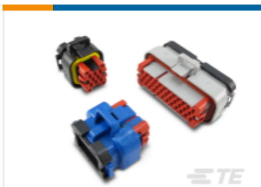
TE 产品编号776273-2 AMPSEAL 母端护套