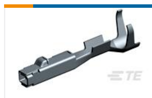
TE 产品编号1418844-3 MCON 1.2 CB REC SWS AG