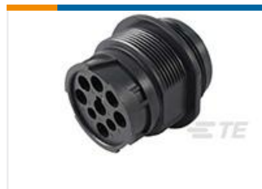
TE 产品编号HD10-9-1939PE-B022 RECP ASM