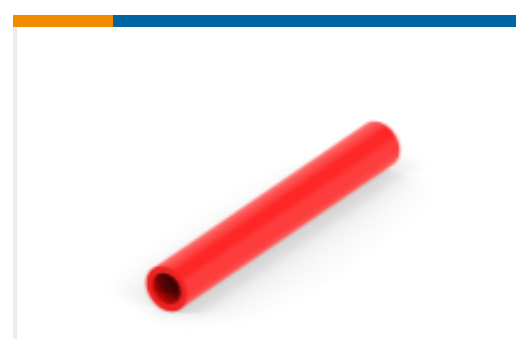
TE 产品编号NB08612001 ATUM-16/4-2-STK