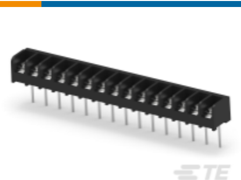
TE 产品编号2-796608-3 6WWW-15-008=#6 TRIBARRIER