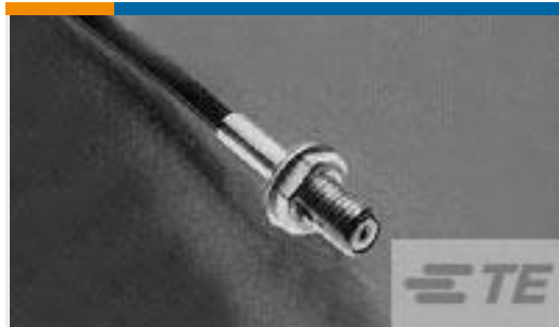
TE 产品编号2-330312-2 MINIATURE THREADED RECEPTACLES