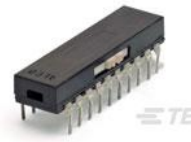
TE 产品编号6-1825011-4 ASF62RG04=6PDT AUTOSLIDE