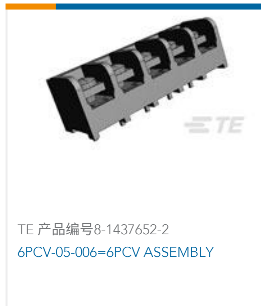
TE 产品编号8-1437652-2 6PCV-05-006=6PCV ASSEMBLY