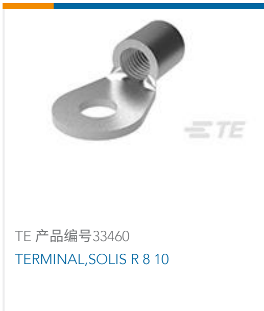
TE 产品编号33460 TERMINAL,SOLIS R 8 10