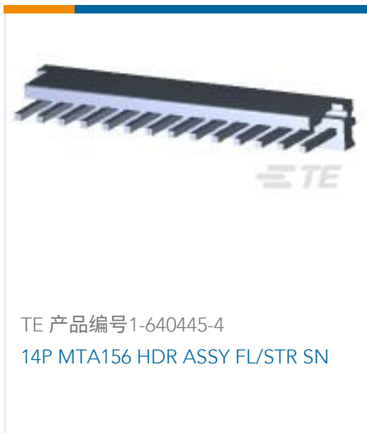
TE 产品编号1-640445-4 14P MTA156 HDR ASSY FL/STR SN