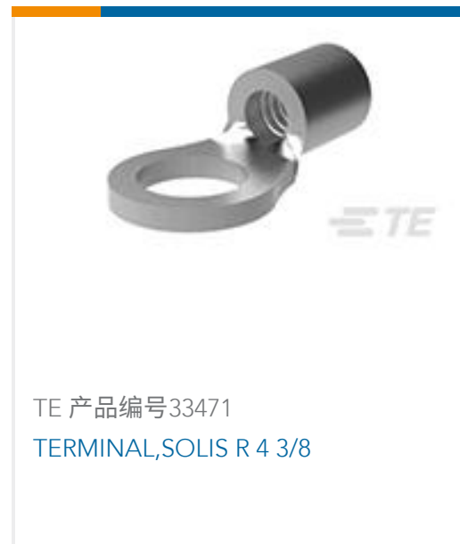
TE 产品编号33471 TERMINAL,SOLIS R 4 3/8