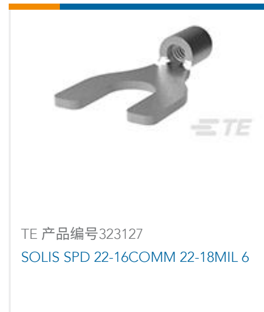
TE 产品编号323127 SOLIS SPD 22-16COMM 22-18MIL 6