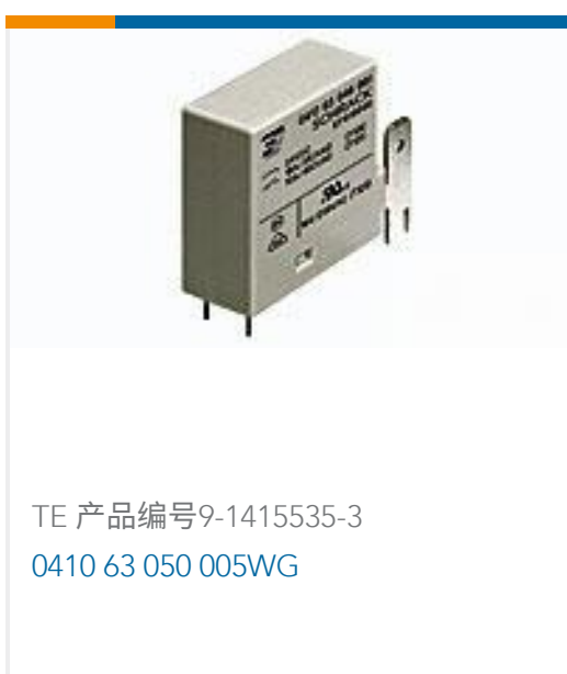
TE 产品编号9-1415535-3 0410 63 050 005WG