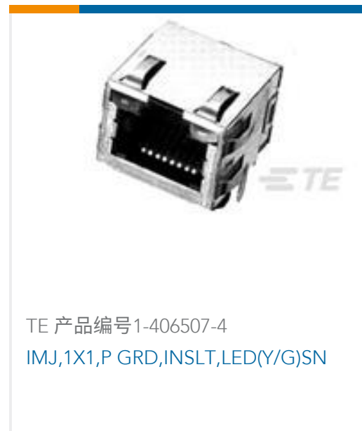
TE 产品编号1-406507-4 IMJ,1X1,P GRD,INSLT,LED(Y/G)SN