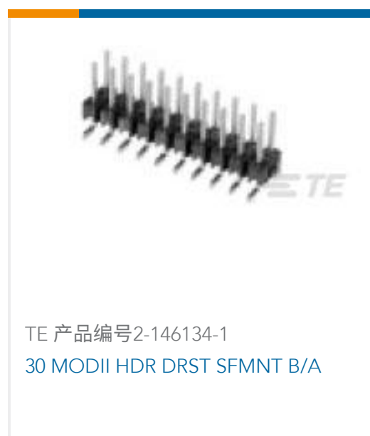
TE 产品编号2-146134-1 30 MODII HDR DRST SFMNT B/A