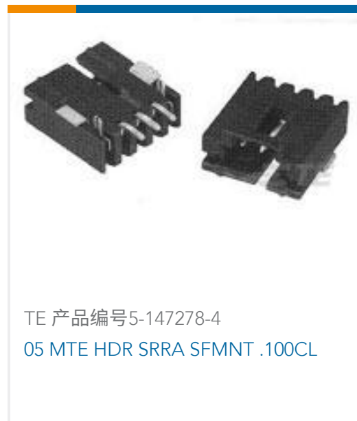
TE 产品编号5-147278-4 05 MTE HDR SRRA SFMNT .100CL