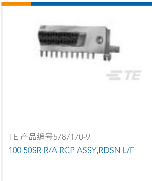
TE 产品编号5787170-9 100 50SR R/A RCP ASSY,RDSN L/F