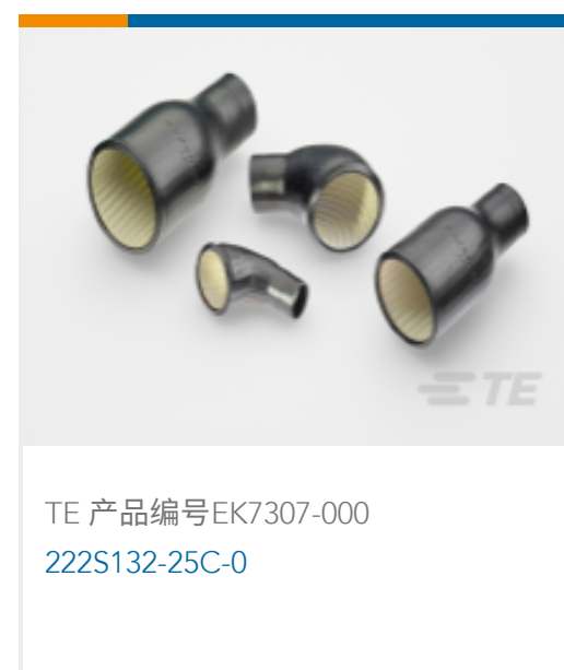
TE 产品编号EK7307-000 222S132-25C-0