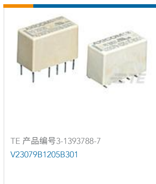
TE 产品编号3-1393788-7 V23079B1205B301