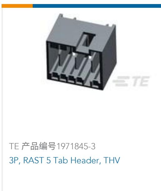
TE 产品编号1971845-3 3P, RAST 5 Tab Header, THV