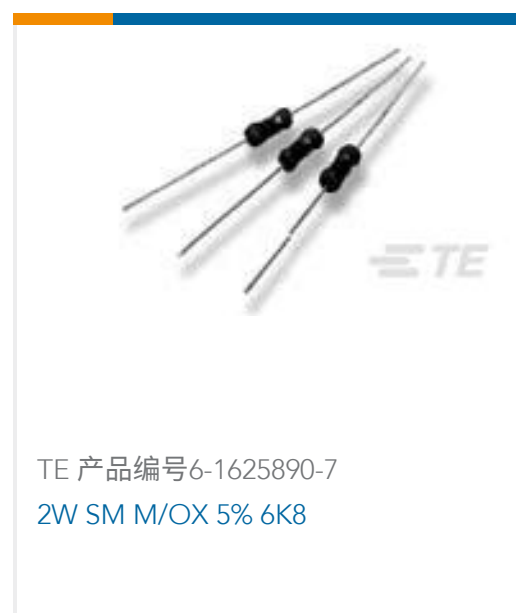
TE 产品编号6-1625890-7 2W SM M/OX 5% 6K8