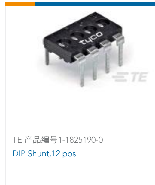
TE 产品编号1-1825190-0 DIP Shunt,12 pos