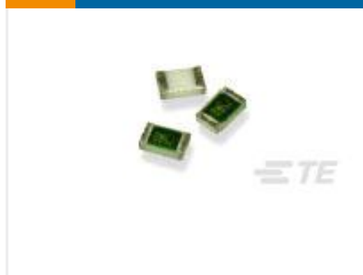
TE 产品编号1-1676481-7 CPF 0603 24R 0.1% 25PPM 1K RL