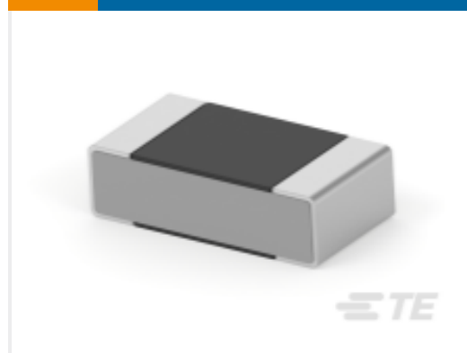
TE 产品编号2-1879207-2 RN 0603 332K 0.1% 10PPM 5K RL