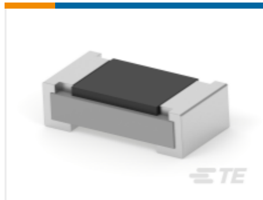
TE 产品编号1-2176237-4 CPF A 0603 120R 0.1% 25PPM 5K RL