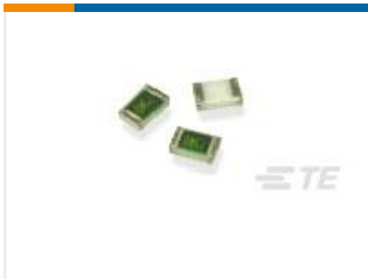
TE 产品编号9-2176091-6 RP 2A 0.25W 590R 0.1% 25PPM 1K RL