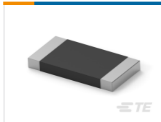
TE 产品编号2-2176422-0 TLRP 2512 3.0W R006 1% 25PPM 4K RL