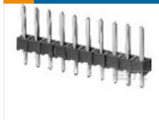
TE 产品编号5-146278-1 01 MODII HDR SRST B/A .100CL