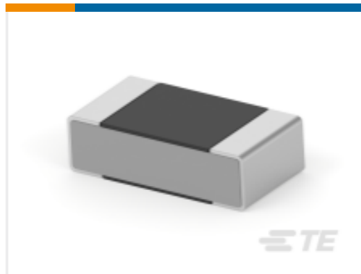
TE 产品编号5-1879207-4 RN 0603 357K 0.1% 10PPM 5K RL