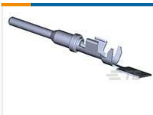
TE 产品编号1060-16-0177 PIN, SF, SIZE 16, 14-18, SN/SN