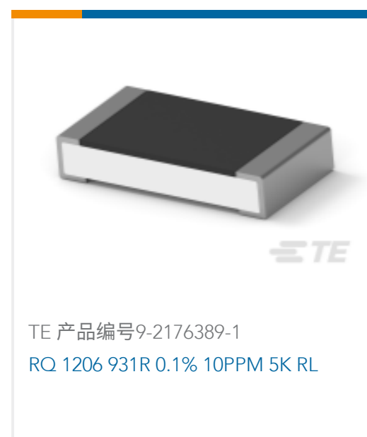
TE 产品编号9-2176389-1 RQ 1206 931R 0.1% 10PPM 5K RL