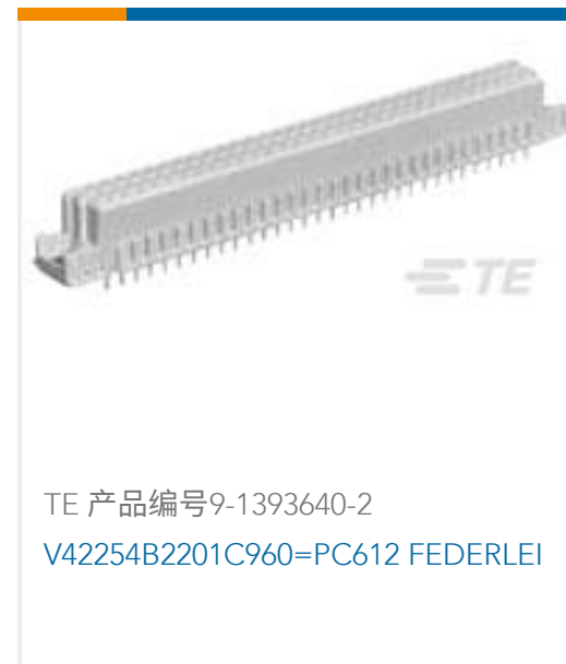
TE 产品编号9-1393640-2 V42254B2201C960=PC612 FEDERLEI