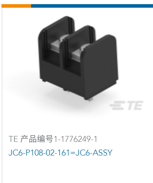
TE 产品编号1-1776249-1 JC6-P108-02-161=JC6-ASSY