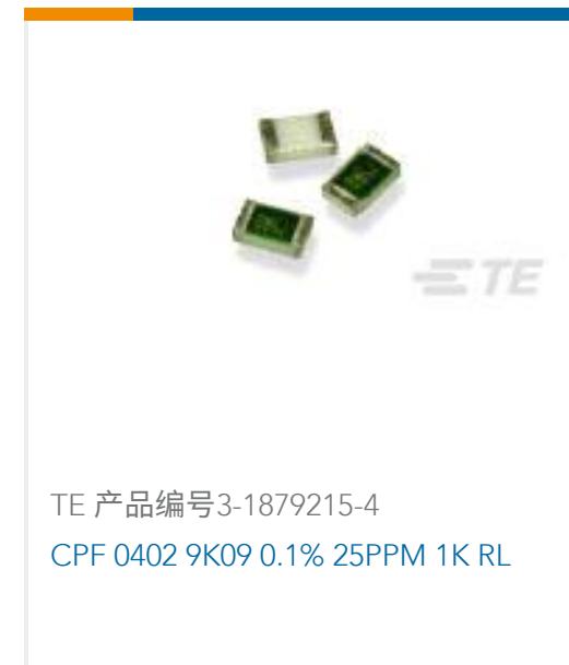
TE 产品编号3-1879215-4 CPF 0402 9K09 0.1% 25PPM 1K RL