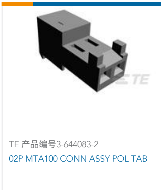
TE 产品编号3-644083-2 02P MTA100 CONN ASSY POL TAB