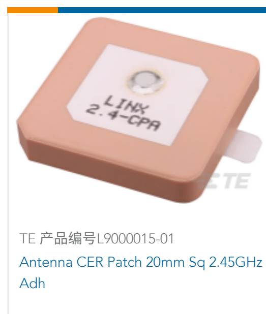
TE 产品编号L9000015-01 Antenna CER Patch 20mm Sq 2.45GHz Adh