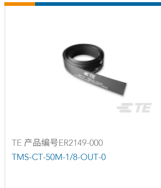
TE 产品编号ER2149-000 TMS-CT-50M-1/8-OUT-0