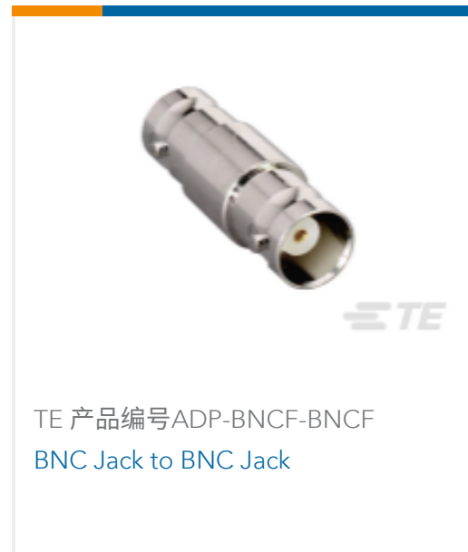
TE 产品编号ADP-BNCF-BNCF BNC Jack to BNC Jack