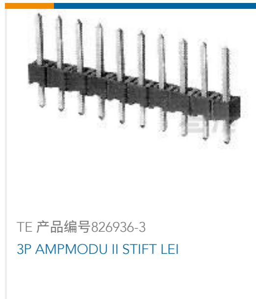
TE 产品编号826936-3 3P AMPMODU II STIFT LEI