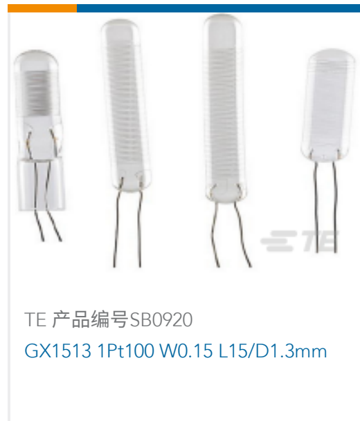
TE 产品编号SB0920 GX1513 1Pt100 W0.15 L15/D1.3mm