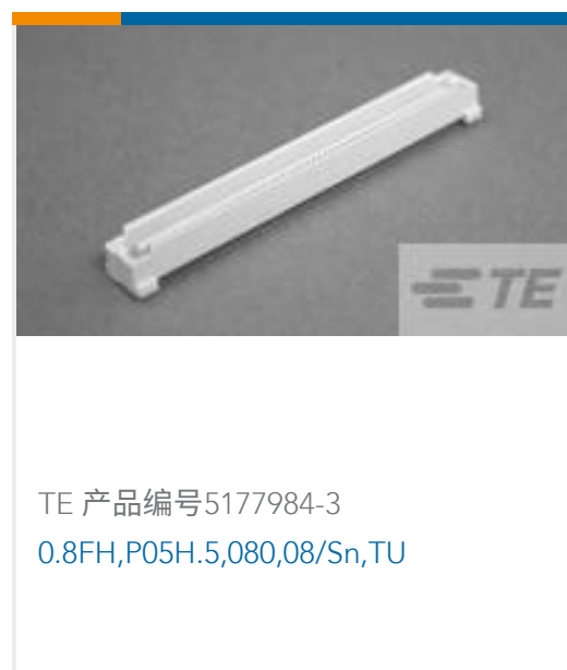
TE 产品编号5177984-3 0.8FH,P05H.5,080,08/Sn,TU