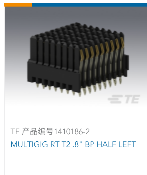
TE 产品编号1410186-2 MULTIGIG RT T2 .8" BP HALF LEFT