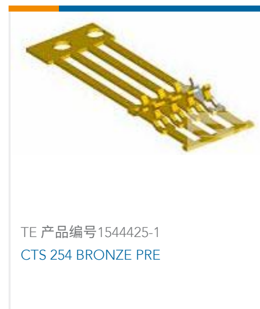
TE 产品编号1544425-1 CTS 254 BRONZE PRE