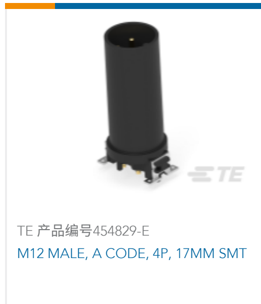
TE 产品编号454829-E M12 MALE, A CODE, 4P, 17MM SMT