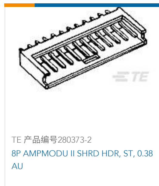
TE 产品编号280373-2 8P AMPMODU II SHRD HDR, ST, 0.38 AU