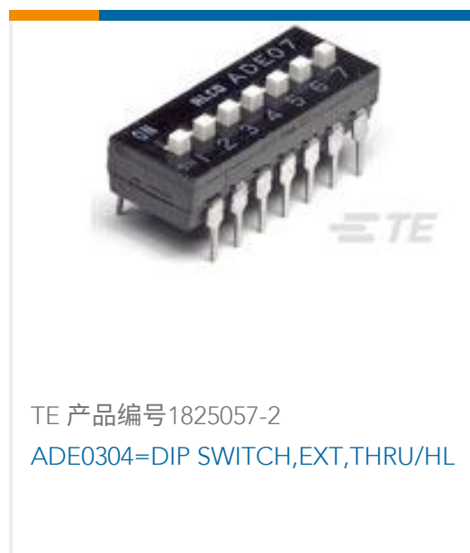
TE 产品编号1825057-2 ADE0304=DIP SWITCH,EXT,THRU/HL