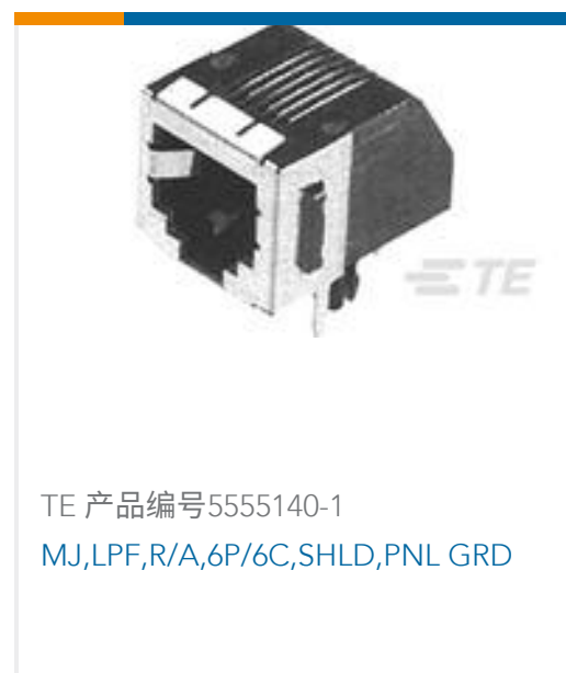
TE 产品编号5555140-1 MJ,LPF,R/A,6P/6C,SHLD,PNL GRD