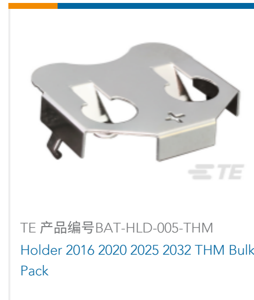
TE 产品编号BAT-HLD-005-THM Holder 2016 2020 2025 2032 THM Bulk Pack