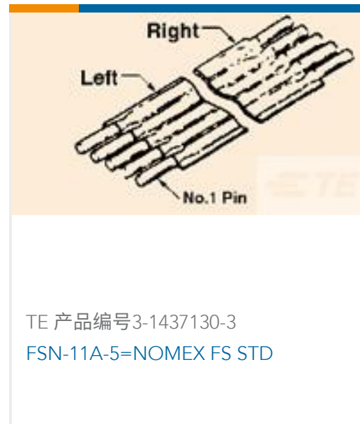
TE 产品编号3-1437130-3 FSN-11A-5=NOMEX FS STD