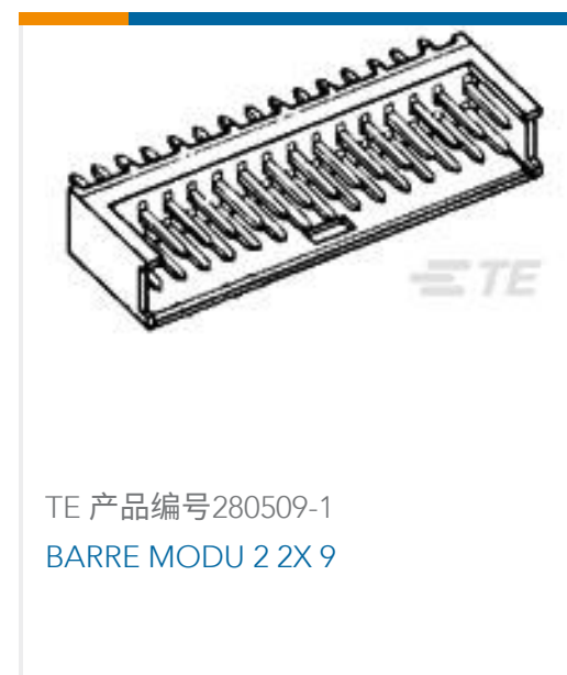
TE 产品编号280509-1 BARRE MODU 2 2X 9