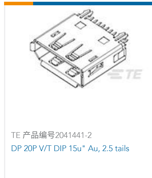
TE 产品编号2041441-2 DP 20P V/T DIP 15u" Au, 2.5 tails