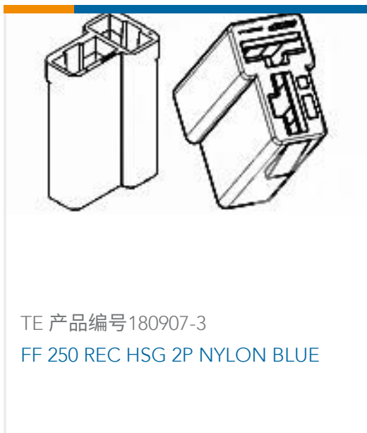
TE 产品编号180907-3 FF 250 REC HSG 2P NYLON BLUE