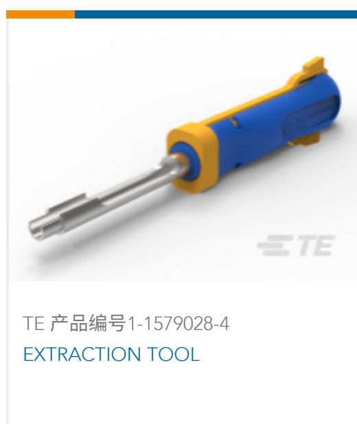
TE 产品编号1-1579028-4 EXTRACTION TOOL