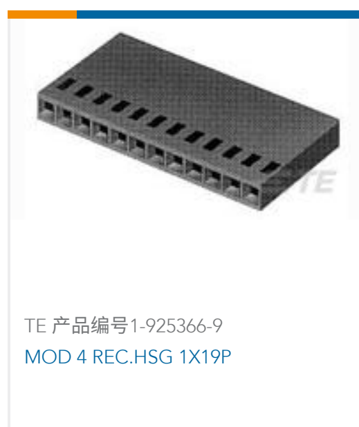
TE 产品编号1-925366-9 MOD 4 REC.HSG 1X19P