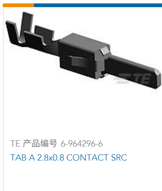
TE 产品编号 6-964296-6 TAB A 2.8x0.8 CONTACT SRC