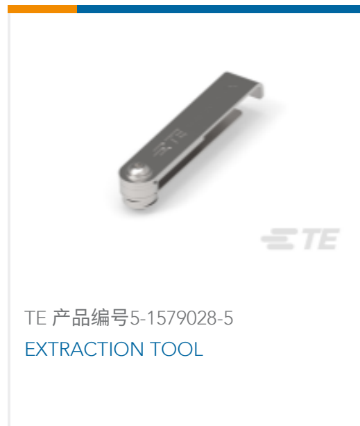
TE 产品编号5-1579028-5 EXTRACTION TOOL