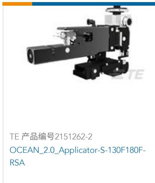
TE 产品编号2151262-2 OCEAN_2.0_Applicator-S-130F180F-RSA