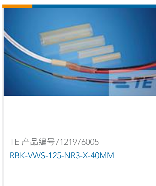
TE 产品编号7121976005 RBK-VWS-125-NR3-X-40MM