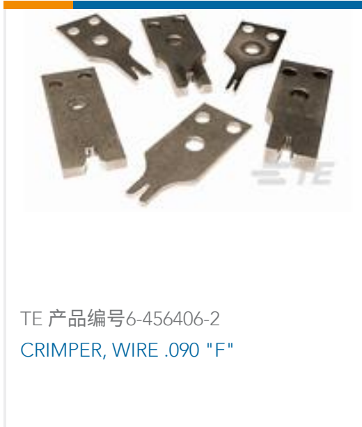
TE 产品编号6-456406-2 CRIMPER, WIRE .090 "F"