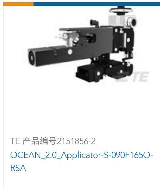
TE 产品编号2151856-2 OCEAN_2.0_Applicator-S-090F165O-RSA