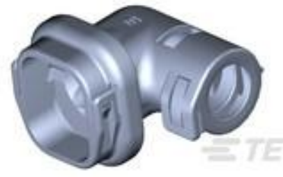
TE 产品编号 1801466-2 COVER, FIXED, 2 WAY HP CONNECTOR