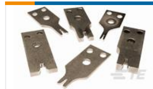
TE 产品编号1-1633961-2 CRIMPER, INSULATION F PREMIUM