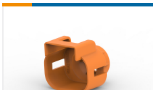
TE 产品编号2103013-3 CABLE SEAL RETAINER, SIZE 2, OR, HVA280