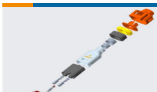
TE 产品编号YHV280-2PM-P-4MM-B HVA280-2p hm, pass, 4sqmm, Key B