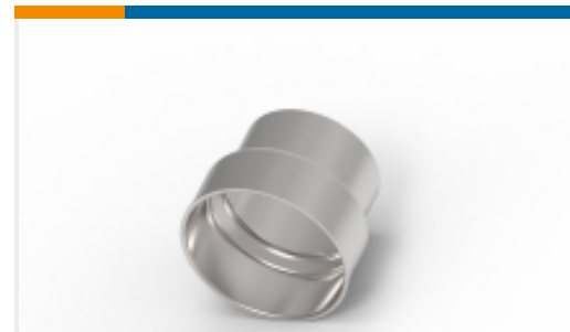
TE 产品编号2177090-3 STEEL, OUTER FERRULE, 8MM HV, 25SQMM