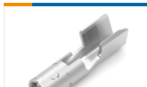
TE 产品编号2208669-3 8MM HV, CONTACT, ASSY