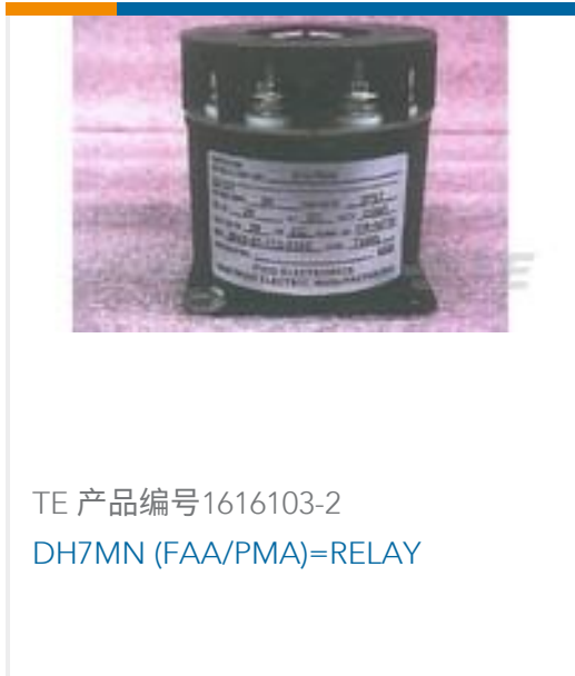
TE 产品编号1616103-2 DH7MN (FAA/PMA)=RELAY