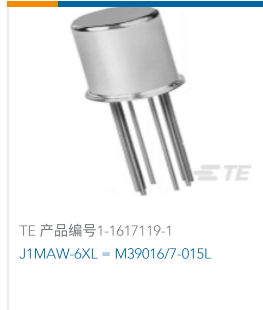
TE 产品编号1-1617119-1 J1MAW-6XL = M39016/7-015L