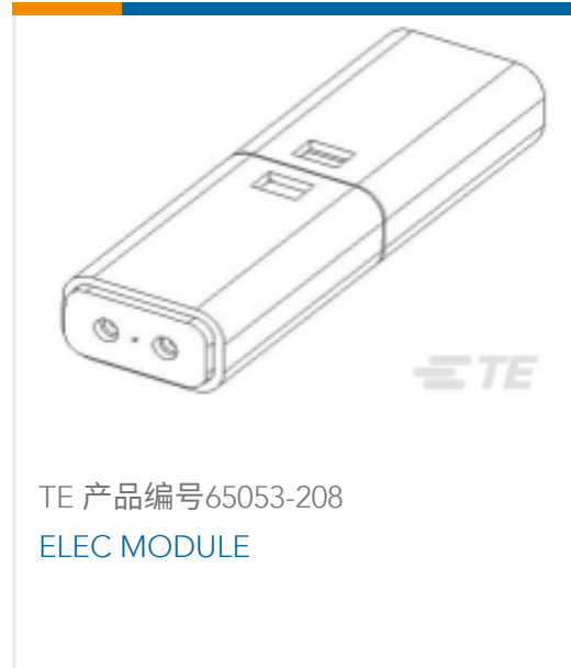
TE 产品编号65053-208 ELEC MODULE