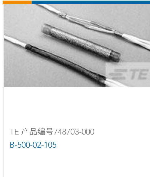
TE 产品编号748703-000 B-500-02-105