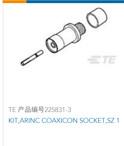
TE 产品编号225831-3 KIT,ARINC COAXICON SOCKET,SZ 1