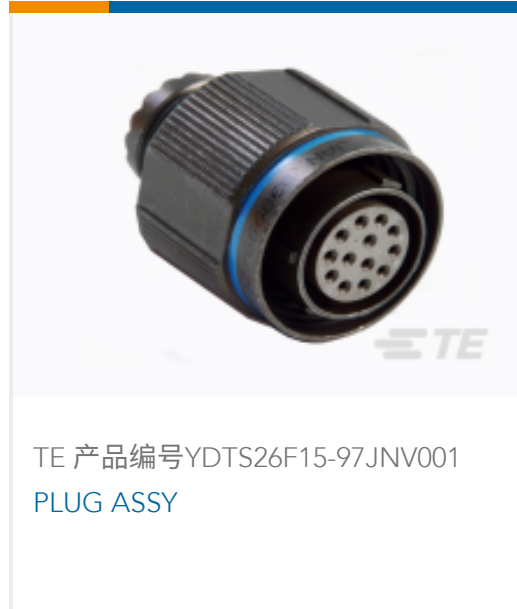
TE 产品编号YDTS26F15-97JNV001 PLUG ASSY