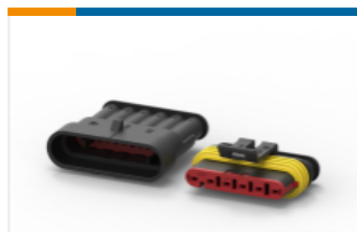
TE 产品编号 282104-1 AMP SUPERSEAL 1.5MM, 连接器壳体