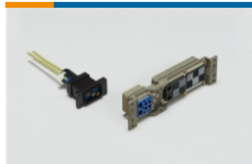
机架和配线架连接器(33)