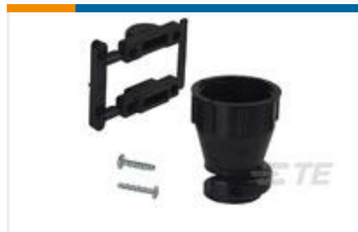
TE 产品编号 206070-8 CABLE CLAMP KIT #17