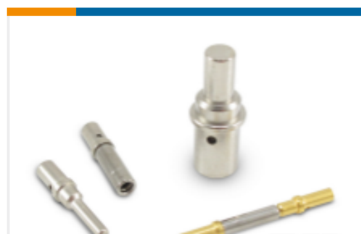
TE 产品编号 0460-202-16141 DEUTSCH Solid Contacts