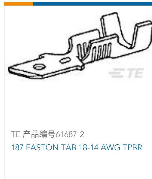
TE 产品编号61687-2 187 FASTON TAB 18-14 AWG TPBR