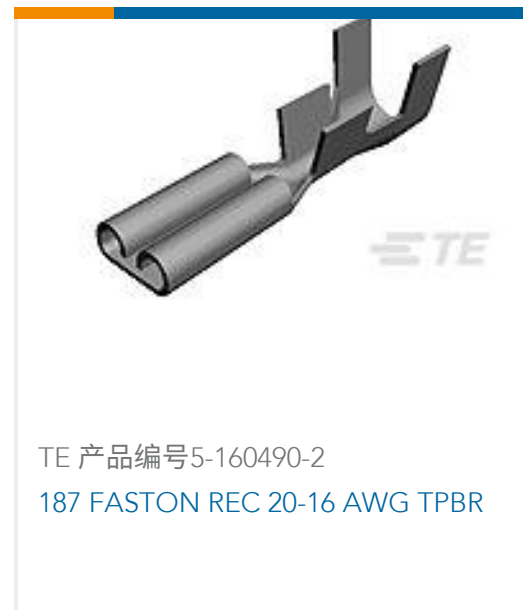
TE 产品编号5-160490-2 187 FASTON REC 20-16 AWG TPBR