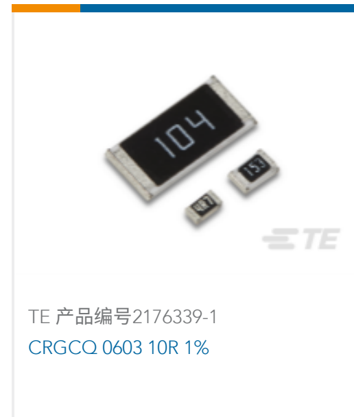
TE 产品编号2176339-1 CRGCO 0603 10R 1%