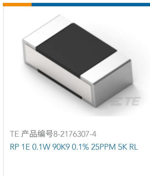
TE 产品编号8-2176307-4 RP 1E 0.1W 90K9 0.1% 25PPM 5K RL