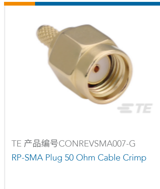
TE 产品编号CONREVSMA007-G RP-SMA Plug 50 Ohm Cable Crimp