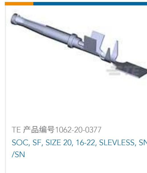
TE 产品编号1062-20-0377 SOC, SF, SIZE 20, 16-22, SLEEVLESS, SN /SN