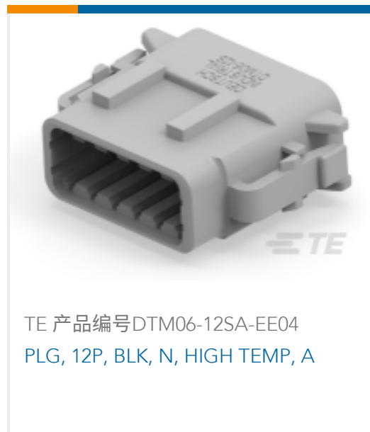
TE 产品编号DTM06-12SA-EE04 PLG, 12P, BLK, N, HIGH TEMP, A