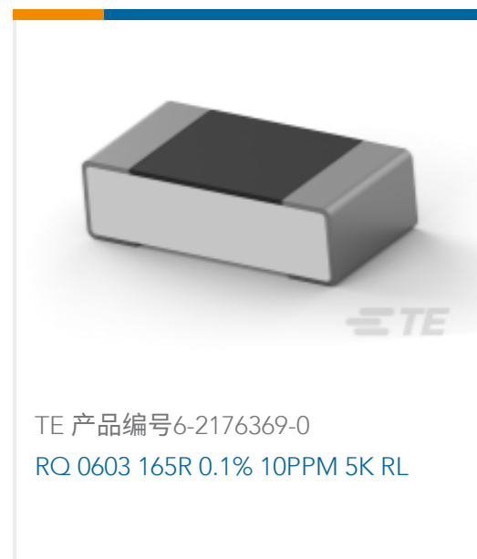
TE 产品编号6-2176369-0 RQ 0603 165R 0.1% 10PPM 5K RL