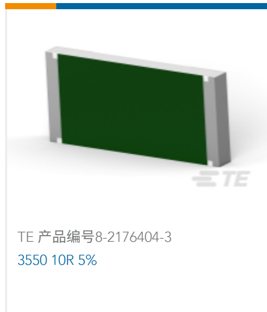
TE 产品编号8-2176404-3 3550 10R 5%