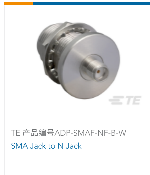
TE 产品编号ADP-SMAF-NF-B-W SMA Jack to N Jack