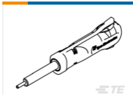
TE 系列/零件编号3-1579018-0 EXTRACTION TOOL