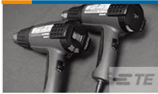
TE 系列/零件编号 CJ2087-000 HL2010E-KIT-120V