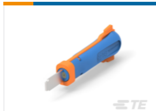
TE 系列/零件编号3-1579028-5 TOOL FOR SECONDARY LOCK