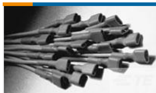
TE 系列/零件编号7798056015 LSTT-9.5-0-30MM