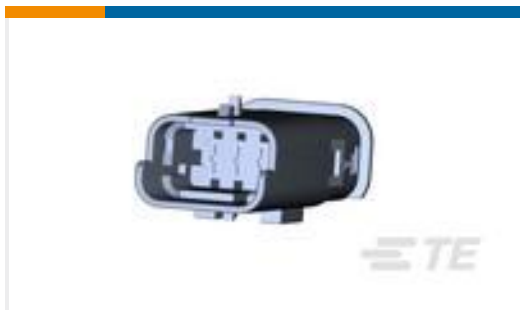
TE 系列/零件编号1801177-5 3W TAB CONNECTOR HP GREEN