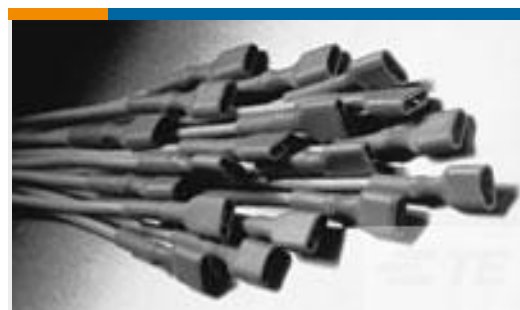
TE 系列/零件编号9097616016 LSTT-4.8-0-30MM