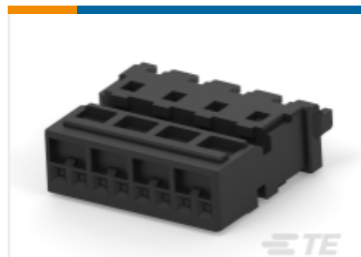
TE 系列/零件编号2208304-1 8POS MQS REC