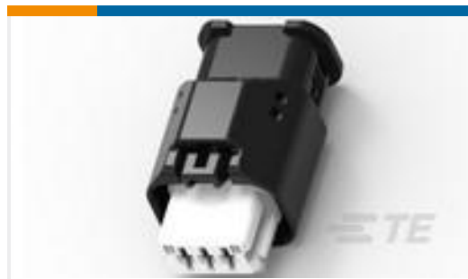
TE 系列/零件编号1801178-7 3W RECEPTACLE HP CONNECTOR WHITE