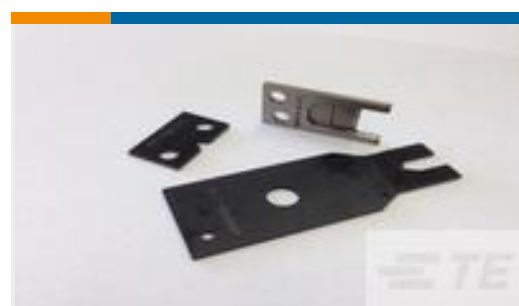
TE 产品编号4-690474-2 BLADE, SLUG