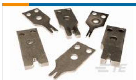
TE 产品编号2-2119784-8 CRIMPER, INSULO PREMIUM