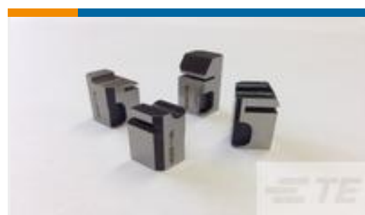
TE 产品编号1803141-1 FLOATING SHEAR, FRONT