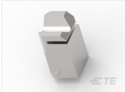
TE 产品编号1803095-7 FLOATING SHEAR, FRONT