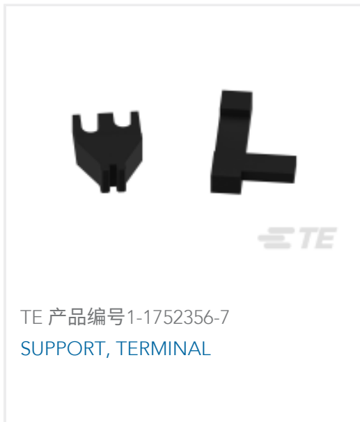
TE 产品编号1-1752356-7 SUPPORT, TERMINAL