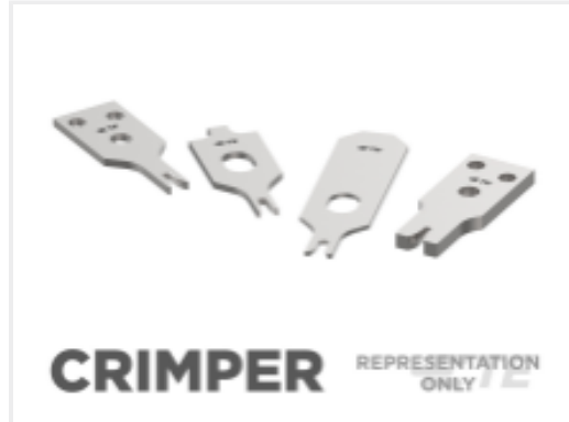
TE 产品编号1803143-6 CRIMPER, INSUL O