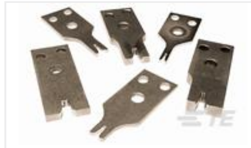
TE 产品编号1633169-2 CRIMPER, WIRE,SPEC.(.070" 'F')