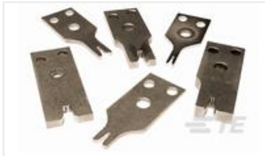
TE 产品编号1-456402-7 CRIMPER WIRE .055 F