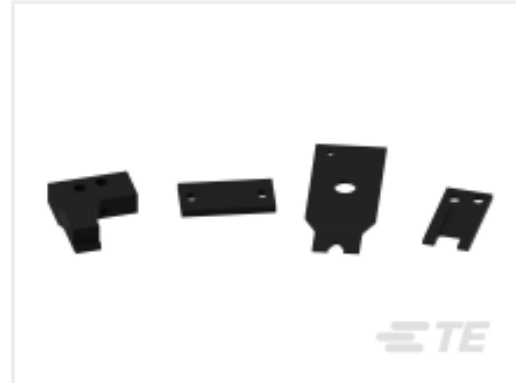
TE 产品编号2119806-1 INSERT, SHEAR