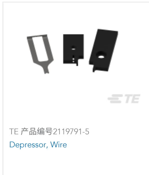
TE 产品编号2119791-5 Depressor, Wire