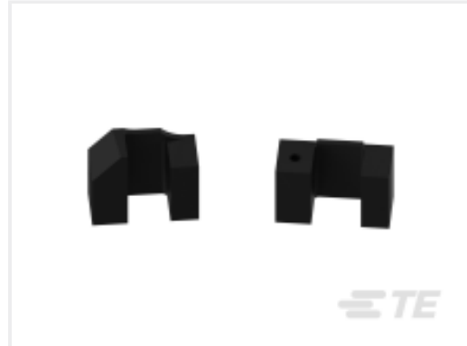
TE 产品编号2119805-1 SHEAR HOLDER, FRONT, CUT