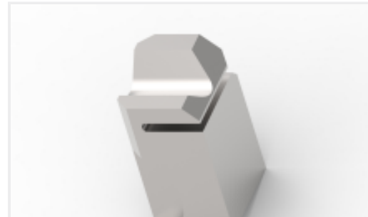
TE 产品编号1803095-6 FLOATING SHEAR, FRONT