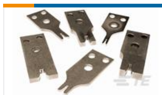
TE 产品编号2-456407-5 CRIMPER, WIRE .100 "F"