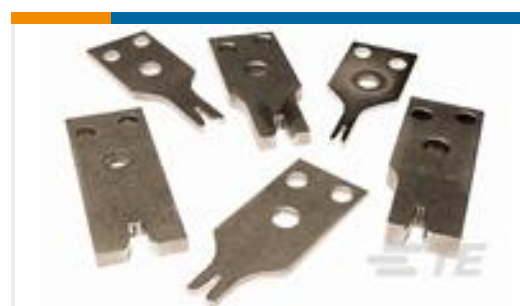
TE 产品编号1803019-5 CRIMPER, INSULATION O