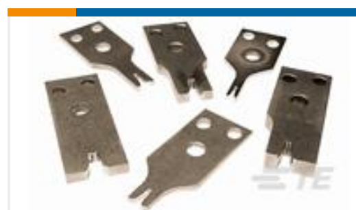
TE 产品编号1-2119784-5 CRIMPER, INSUL O PREMIUM