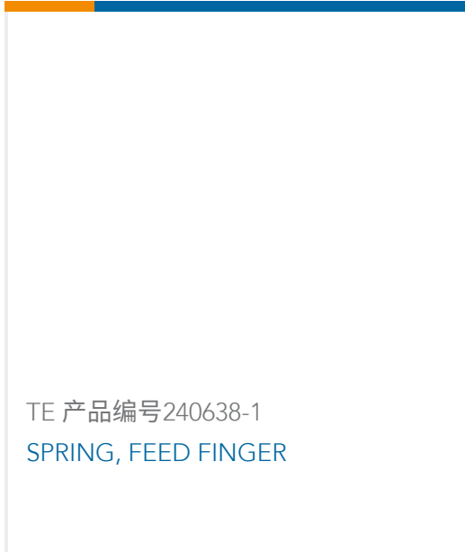
TE 产品编号240638-1 SPRING, FEED FINGER