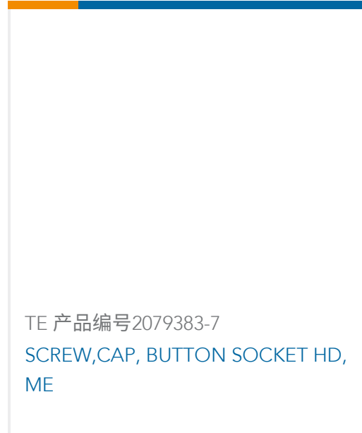
TE 产品编号2079383-7 SCREW,CAP, BUTTON SOCKET HD, ME