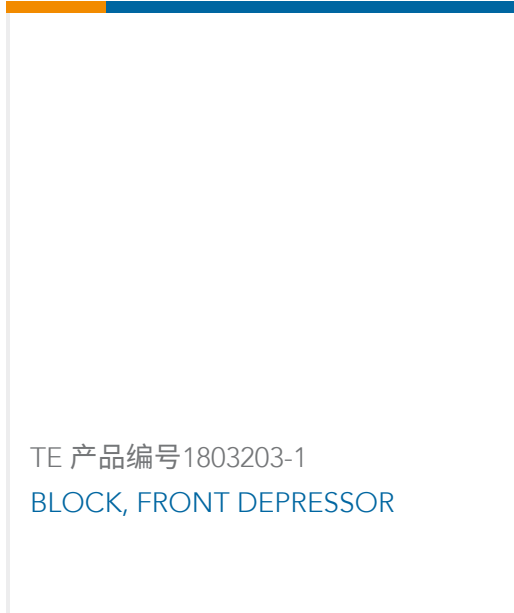
TE 产品编号1803203-1 BLOCK, FRONT DEPRESSOR