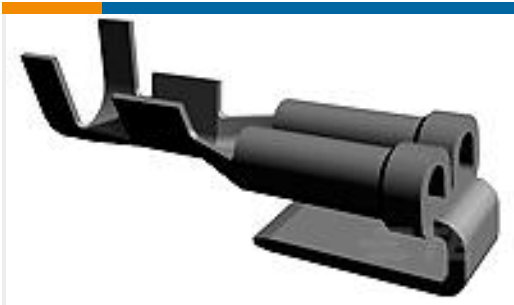
TE 产品编号62003-2 110 FASTON REC 22-18 AWG TPBR