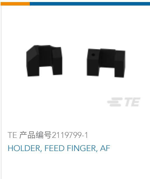
TE 产品编号2119799-1 HOLDER, FEED FINGER, AF