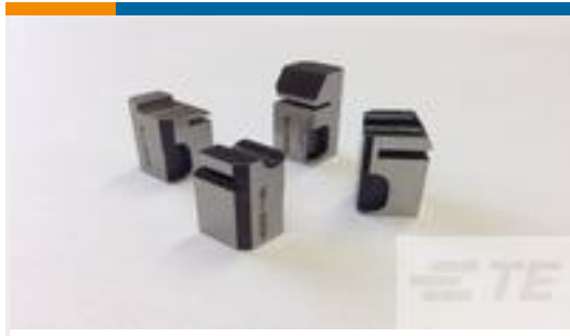
TE 产品编号1803095-1 FLOATING SHEAR, FRONT