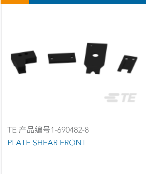
TE 产品编号1-690482-8 PLATE SHEAR FRONT