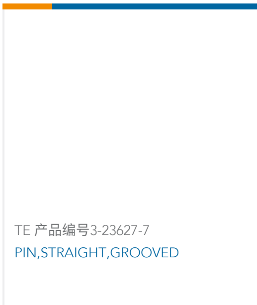
TE 产品编号3-23627-7 PIN,STRAIGHT,GROOVED