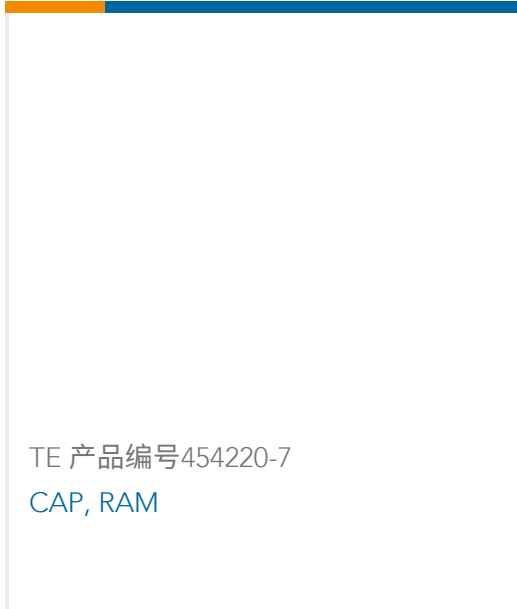
TE 产品编号454220-7 CAP, RAM