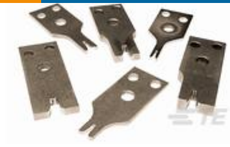
TE 产品编号2-1633730-5 CRIMPER, WIRE F .070 F