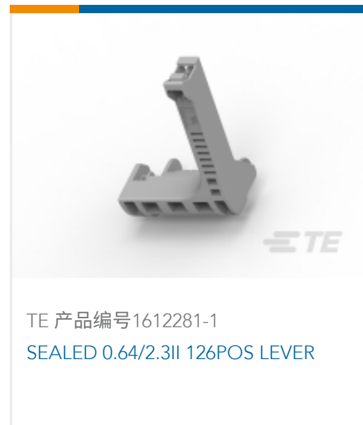
TE 产品编号1612281-1 SEALED 0.64/2.3II 126POS LEVER