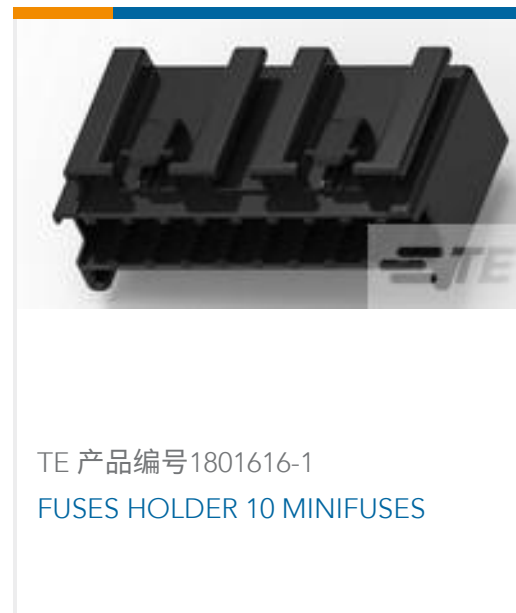
TE 产品编号1801616-1 FUSES HOLDER 10 MINIFUSES