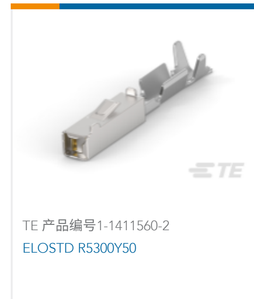
TE 产品编号1-1411560-2 ELOSTD R5300Y50