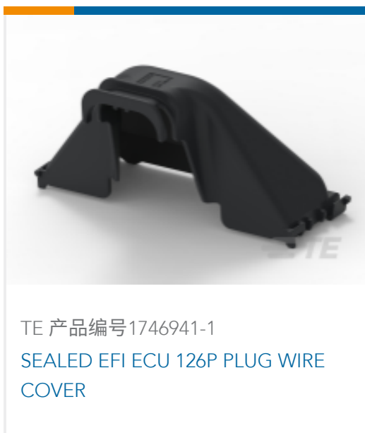
TE 产品编号1746941-1 SEALED EFI ECU 126P PLUG WIRE COVER