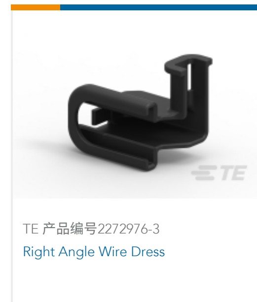
TE 产品编号2272976-3 Right Angle Wire Dress