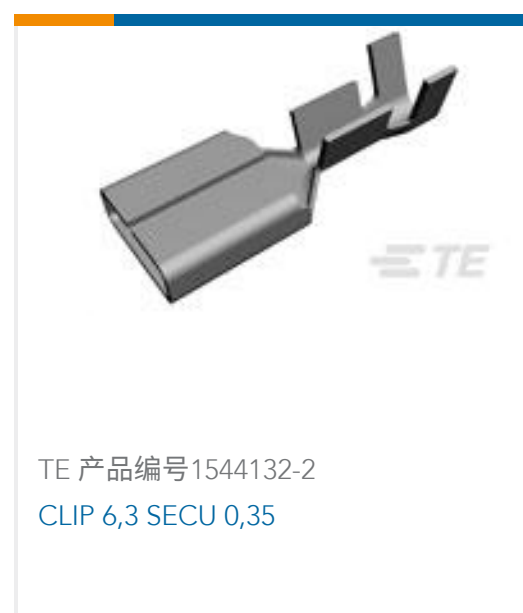
TE 产品编号1544132-2 CLIP 6,3 SECU 0,35