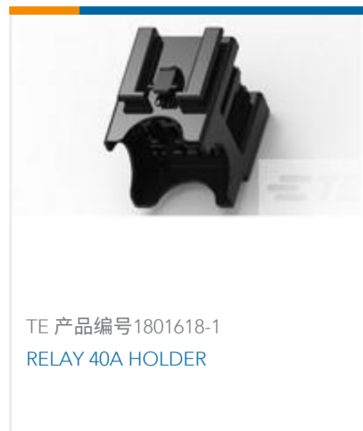
TE 产品编号1801618-1 RELAY 40A HOLDER