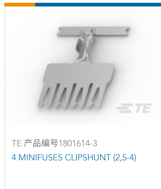
TE 产品编号1801614-3 4 MINIFUSES CLIPSHUNT (2,5-4)