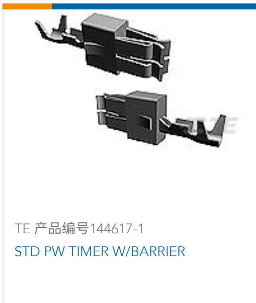
TE 产品编号144617-1 STD PW TIMER W/BARRIER