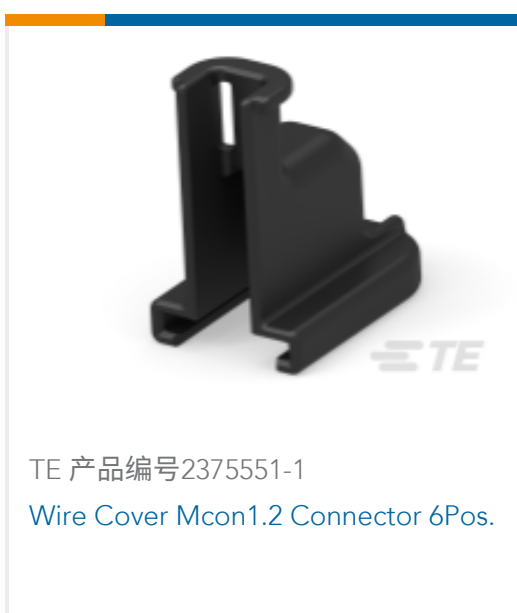
TE 产品编号2375551-1 Wire Cover Mcon1.2 Connector 6Pos.