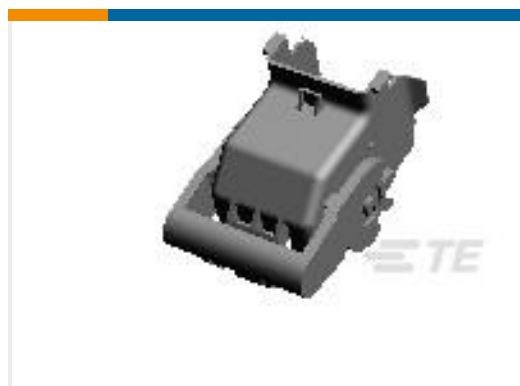
TE 产品编号1452416-1 58POS CONNECTOR COVER 180 ASSY