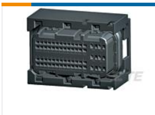
TE 产品编号9-1452415-9 58POS CONNECTOR ASSY F. CONNECTOR154POS