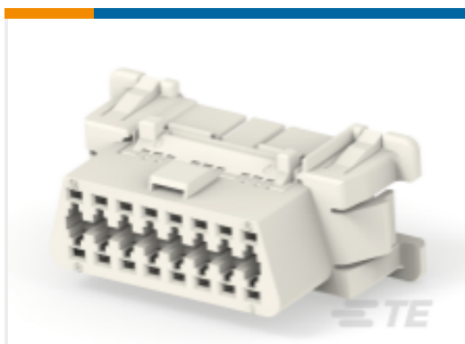
TE 产品编号2301724-5 16POS,060 SERIES,REC HSG,UNSLD