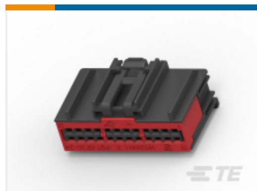
TE 产品编号1452839-5 24 POS FEMALE HSG ASSY