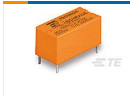
TE 产品编号1415390-1 PE014F03