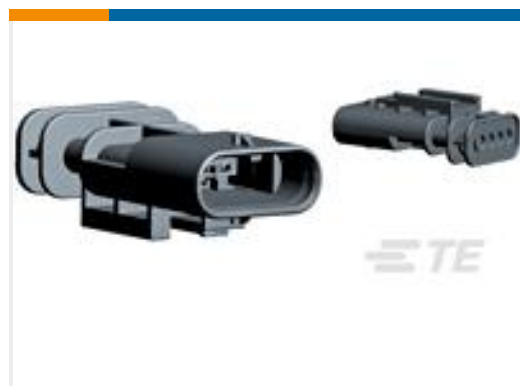
TE 产品编号1-1564559-1 4POS, MCON 1.2 LL TAB SEALED COD A