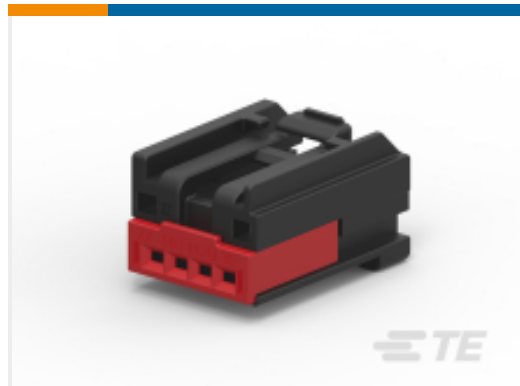
TE 产品编号1456983-1 1X4 FEM UNSEALED LOW PROFILE, KEY A