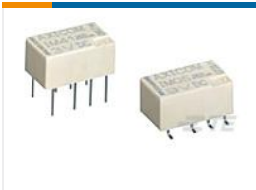
TE 产品编号5-1462037-3 IM41TS=IM RELAY 100mW 3V BIS