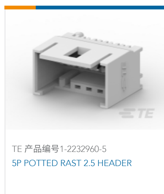
TE 产品编号1-2232960-5 5P POTTED RAST 2.5 HEADER