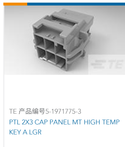
TE 产品编号5-1971775-3 PTL 2X3 CAP PANEL MT HIGH TEMP KEY A LGR