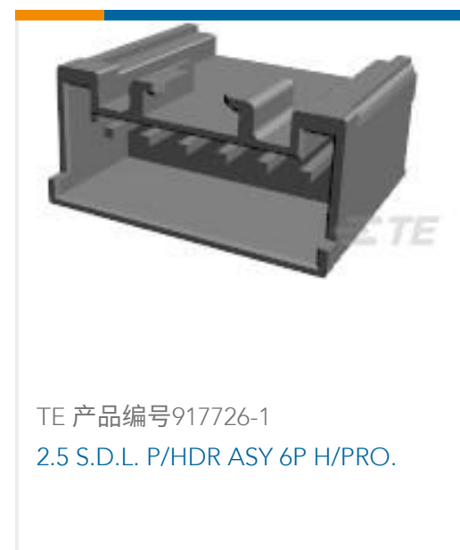
TE 产品编号917726-1 2.5 S.D.L. P/HDR ASY 6P H/PRO.