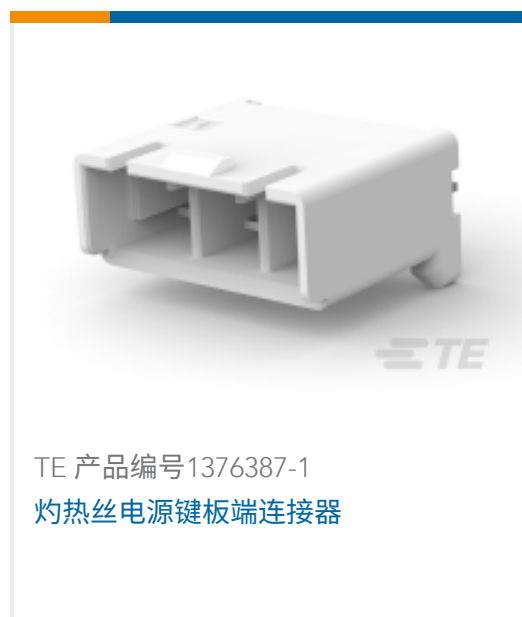
TE 产品编号1376387-1 灼热丝电源键板端连接器