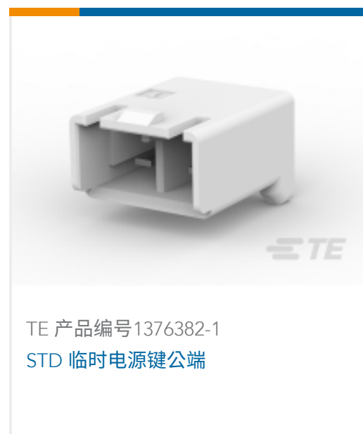
TE 产品编号1376382-1 STD 临时电源键公端