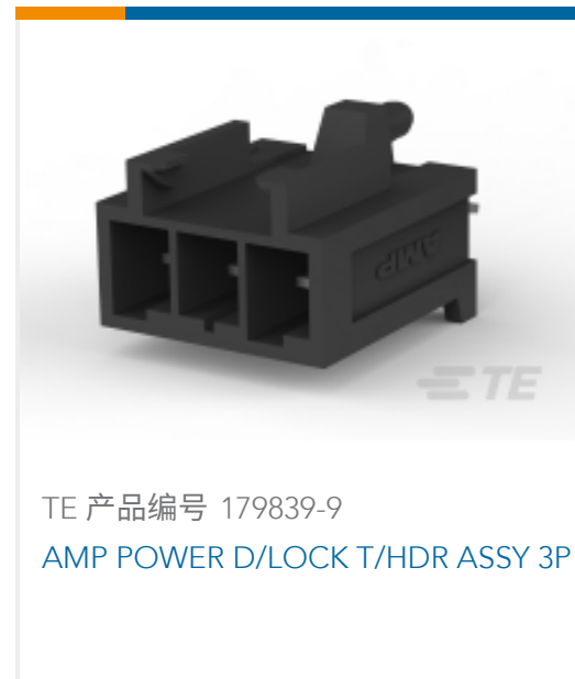
TE 产品编号 179839-9 AMP POWER D/LOCK T/HDR ASSY 3P