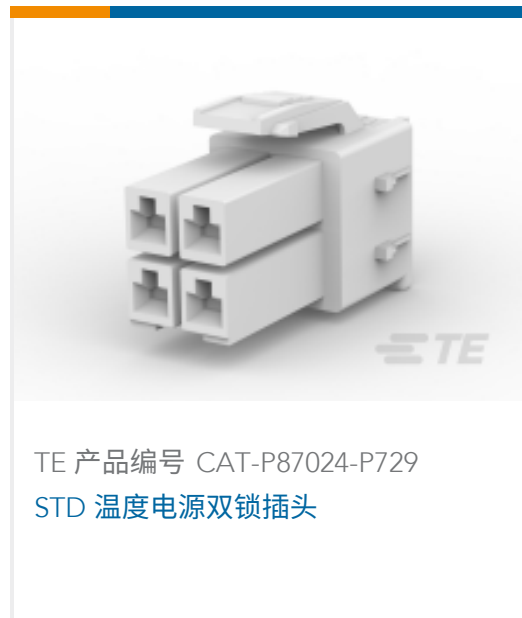
TE 产品编号 CAT-P87024-P729 STD 温度电源双锁插头