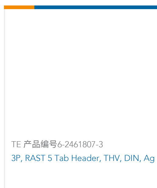
TE 产品编号6-2461807-3 3P, RAST 5 Tab Header, THV, DIN, Ag