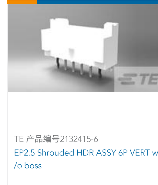
TE 产品编号2132415-6 EP2.5 Shrouded HDR ASSY 6P VERT w /o boss