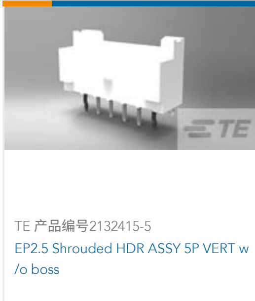
TE 产品编号2132415-5 EP2.5 Shrouded HDR ASSY 5P VERT w /o boss