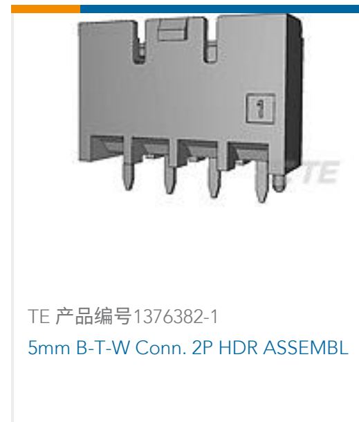
TE 产品编号1376382-1 5mm B-T-W Conn. 2P HDR ASSEMBL