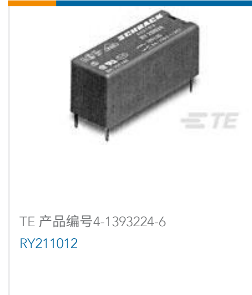
TE 产品编号4-1393224-6 RY211012