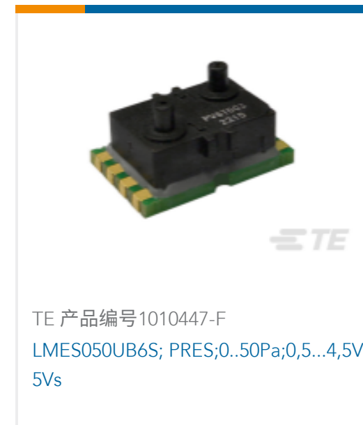
TE 产品编号1010447-F LMES050UB6S; PRES;0..50Pa;0.5...4,5V; 5Vs