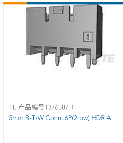
TE 产品编号1376387-1 5mm B-T-W Conn. 6P(2row) HDR A