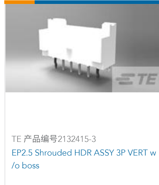
TE 产品编号2132415-3 EP2.5 Shrouded HDR ASSY 3P VERT w /o boss