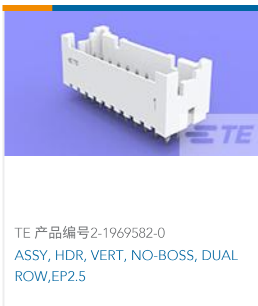
TE 产品编号2-1969582-0 ASSY, HDR, VERT, NO-BOSS, DUAL ROW, EP2.5