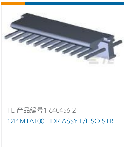
TE 产品编号1-640456-2 12P MTA100 HDR ASSY F/L SQ STR