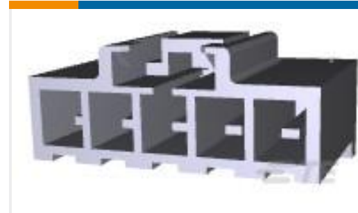
TE 产品编号178488-1 UP 3.96 5P TAB HDR NAT TYPE 1