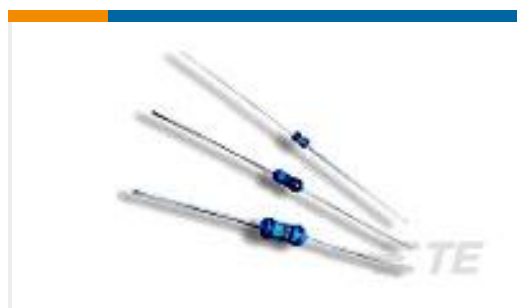
TE 产品编号8-1879026-9 YR1 0.1% 499K