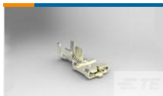
TE 产品编号2178301-1 250 FASTON,F-SPR REC.,20-18 AWG, PNST