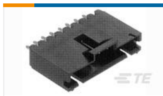
TE 产品编号5-103735-2 03 MTE HDR SRST LATCH .100CL