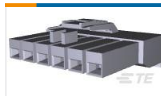
TE 产品编号178483-1 UP 3.96 6P PLUG HSG NATRL