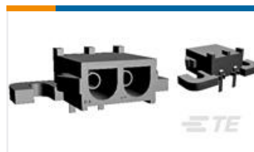
TE 产品编号643226-1 02P UMNL HDR ASSY R/A 94VO