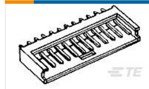
TE 产品编号280374-1 10P AMPMODU II SHRD HDR, ST, TIN