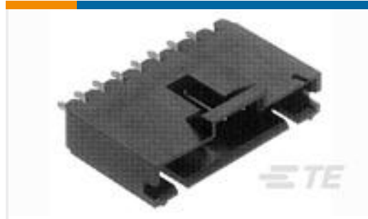
TE 产品编号5-103735-1 02 MTE HDR SRST LATCH .100CL