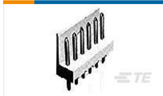
TE 产品编号171825-7 V-TYPE E.I.S.CONN. 7P ASSY