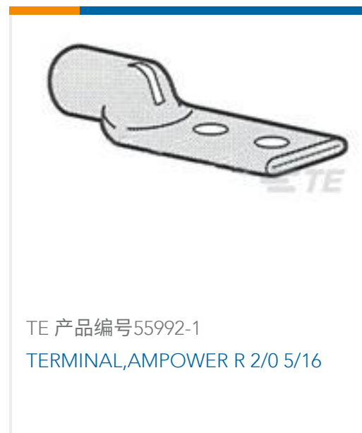
TE 产品编号55992-1 TERMINAL,AMPOWER R 2/0 5/16