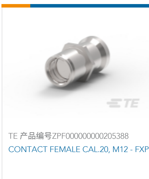
TE 产品编号ZPF000000000205388 CONTACT FEMALE CAL.20, M12 - FXP