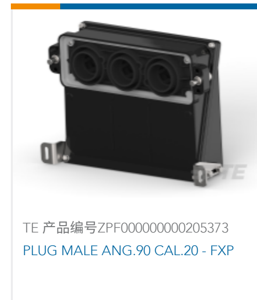
TE 产品编号ZPF000000000205373 PLUG MALE ANG.90 CAL.20 - FXP