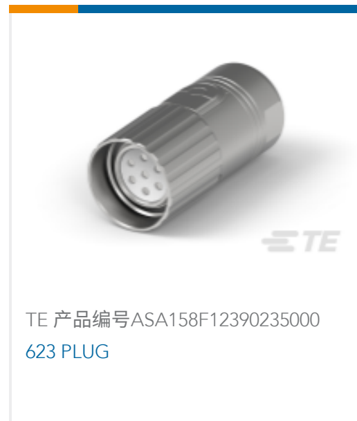
TE 产品编号ASA158F12390235000 623 PLUG