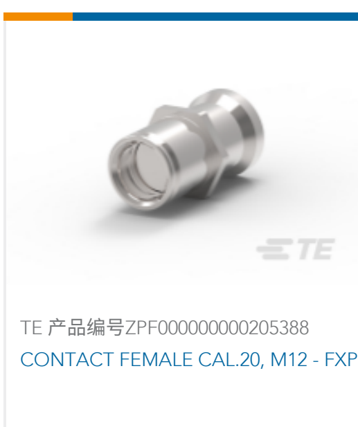
TE 产品编号ZPF000000000205388 CONTACT FEMALE CAL.20, M12 - FXP