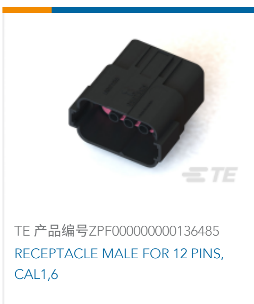
TE 产品编号ZPF000000000136485 RECEPTACLE MALE FOR 12 PINS, CAL1,6