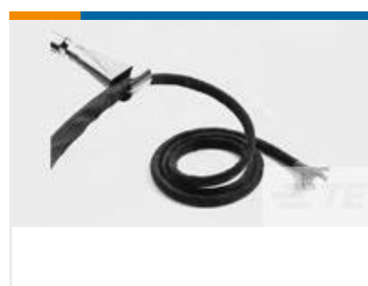
TE 产品编号CB03374007 RW-200-E-1/2-0-SP