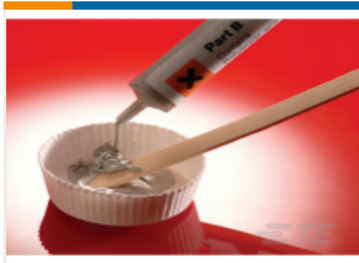
TE 产品编号369276-000 S1184-KIT-1