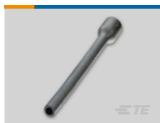
TE 产品编号057233-000 小尺寸热缩护套：聚合物成型，有嘴，直形