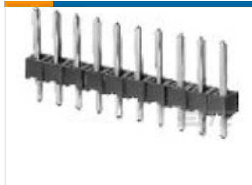
TE 产品编号9-146280-0 40 MODII HDR SRST B/A .100CL