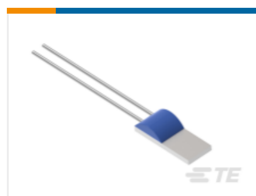
TE 产品编号NB-PTCO-126 Pt1000, 2.0x5.0, Class B, PTFD102B1G0