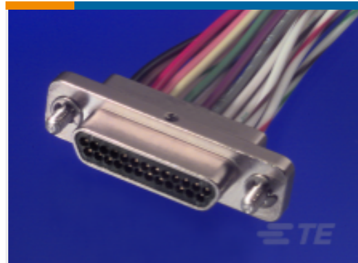
TE 产品编号1532182-3 M83513/03-D03N, MCKS-N1-B-25P6G9-18.0