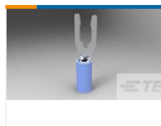
TE 产品编号52421-1 TERMINAL, PIDG SPR SPD 16-14 8