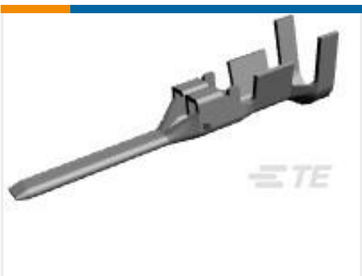
TE 产品编号1565080-1 GRACE INERTIA 3.5 TAB CONTACT(L)