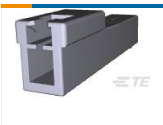
TE 产品编号176281-1 UNIV POWER CAP HSG 1P F/H