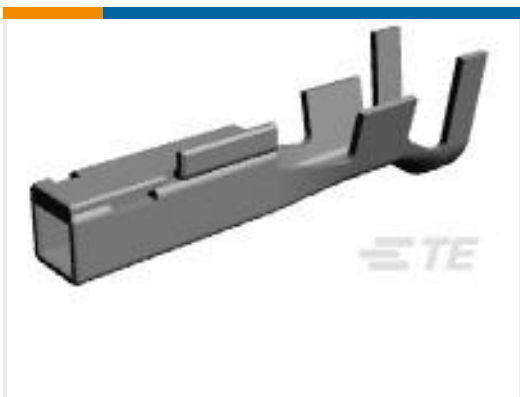
TE 产品编号1565079-1 GRACE INERTIA 3.5 REC CONTACT(L)