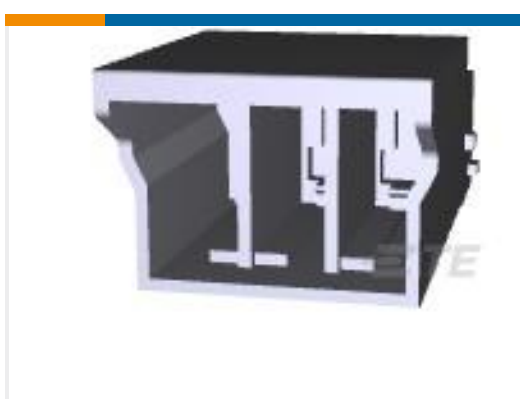
TE 产品编号1565086-1 GRACE INERTIA CONNECTOR 3.5 3P