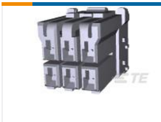
TE 产品编号1565084-1 GRACE INERTIA CONNECTOR 3.5 6P