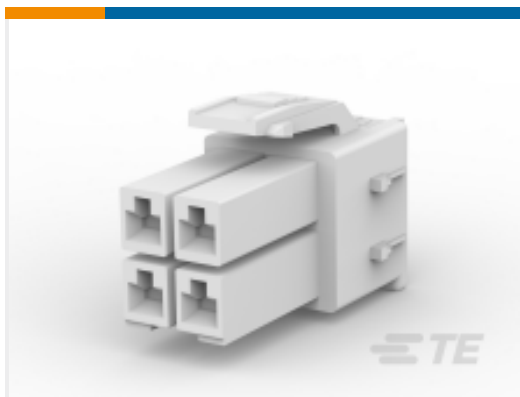
TE 产品编号316768-2 STD 温度电源双锁插头