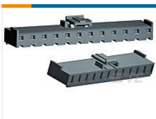
TE 产品编号1744036-3 03P ECONOMY POWER .200 CL HSG