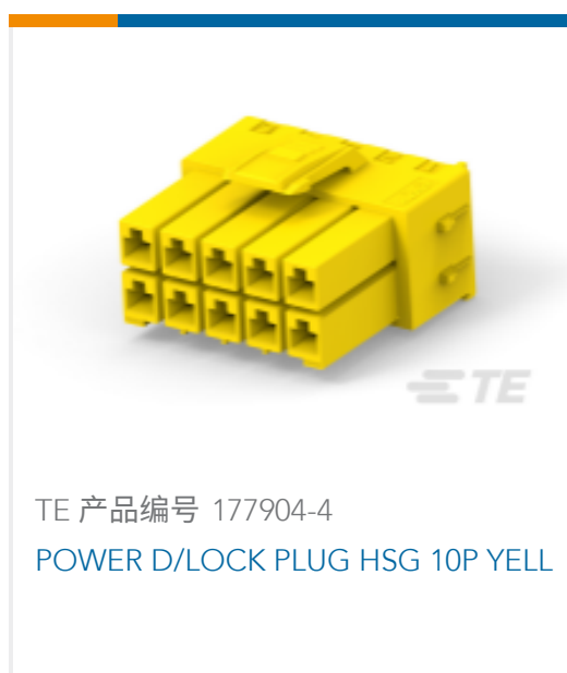
TE 产品编号 177904-4 POWER D/LOCK PLUG HSG 10P YELL