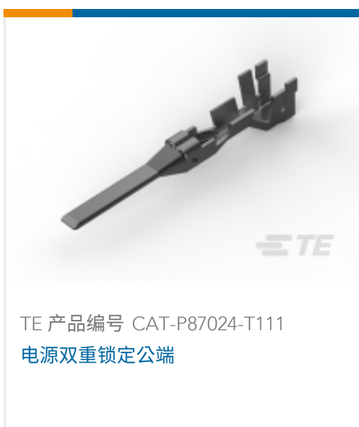
TE 产品编号 CAT-P87024-T111 电源双重锁定公端