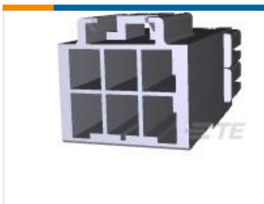
TE 产品编号179466-1 AMP POWER DBL LOCK CAP HSG 6P