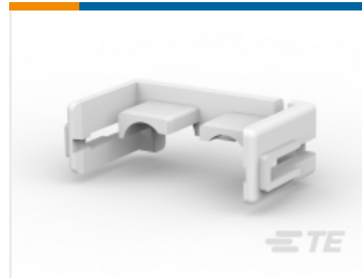
TE 产品编号177918-1 电源双锁 TPA