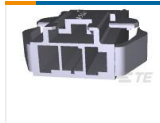
TE 产品编号177907-1 POWER DBL LOCK CAP P/M 3P