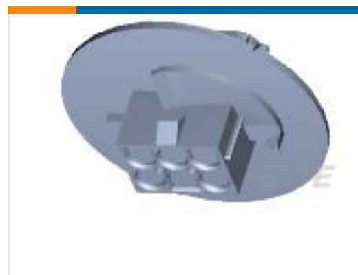
TE 产品编号794760-1 06P UMNL CAP HSG WHITE,PAN MNT