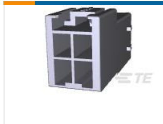
TE 产品编号179465-1 AMP POWER DBL LOCK CAP HSG 4P