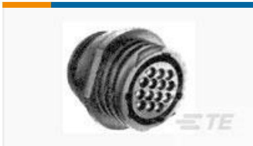
TE 产品编号206043-3 17-14 CPC REC FREE HANGING