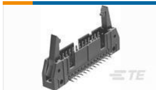
TE 产品编号5499141-2 A/L UNIV HDR 14P RA LG LAT