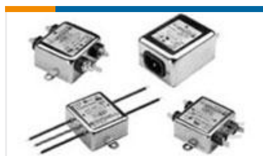
TE 产品编号1-6609027-5 10EK7=F7095 S0