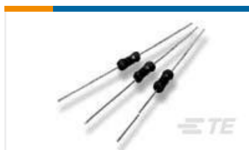
TE 产品编号9-1879352-1 RR02 5% 1K8 AMMO