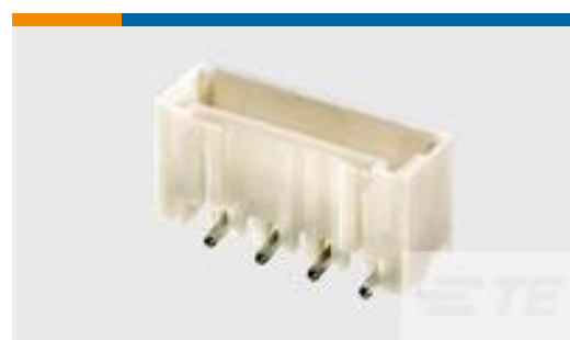
TE 产品编号292231-3 1.5 MINI CT SGL V SMT W/O BOSS