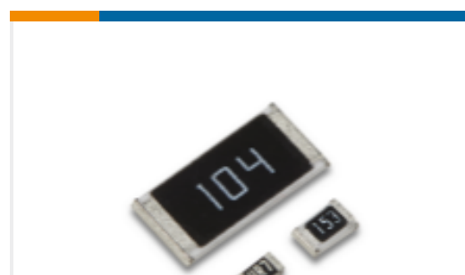
TE 产品编号2176347-6 CRGCQ 2010 27R 1%