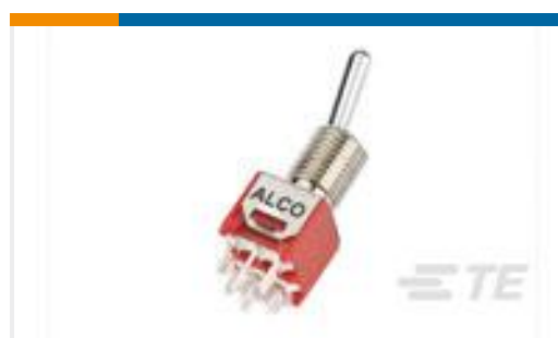
TE 产品编号2267077-1 TMS1T4B5M2RE