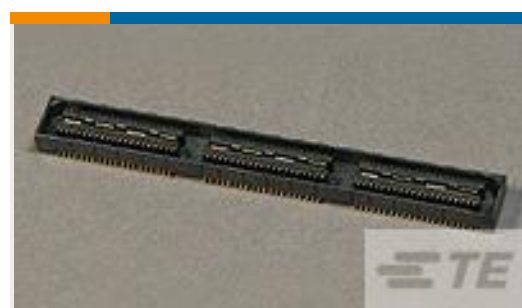
TE 产品编号2-1658012-3 MSB0.80RC-ASY120FL,-,10,-TY