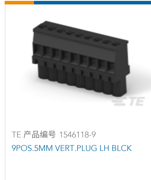
TE 产品编号 1546118-9 9 POS 5.0 MM VERT. PLUG LH BLCK