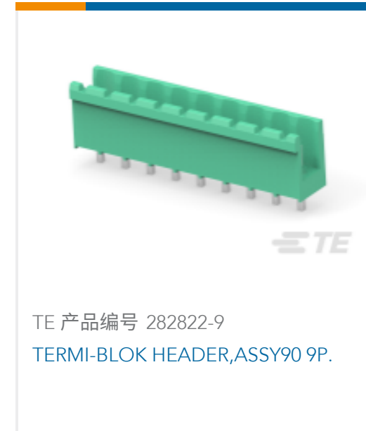
TE 产品编号 282822-9 TERMI-BLOK HEADER, ASSY 9P.