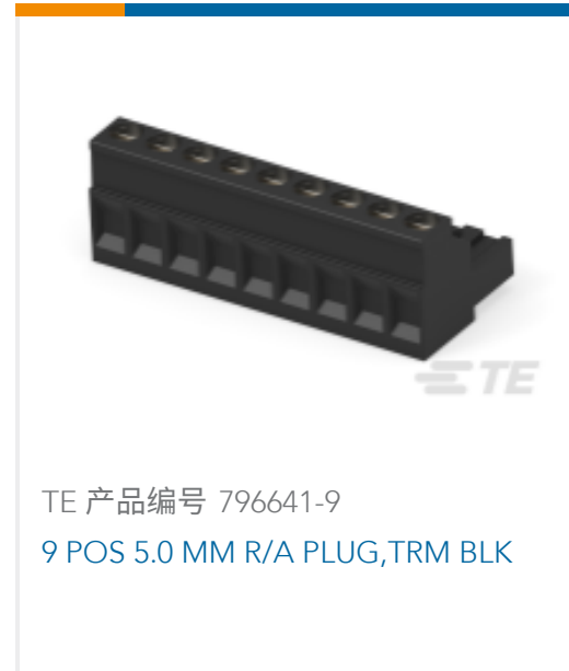
TE 产品编号 796641-9 9 POS 5.0 MM R/A PLUG, TRM BLK