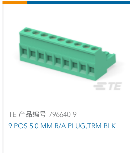
TE 产品编号 796640-9 9 POS 5.0 MM R/A PLUG, TRM BLK