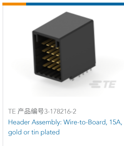
TE 产品编号 3-178216-2 Header Assembly: Wire-to-Board, 15A, gold or tin plated