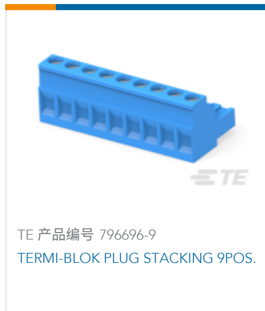
TE 产品编号 796696-9 TERMI-BLOK PLUG STACKING 9 POS.