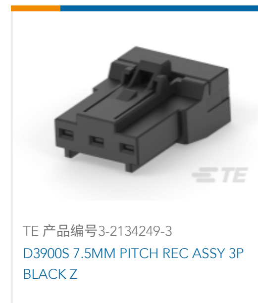
TE 产品编号 3-2134249-3 D3900S 7.5MM PITCH REC ASSY 3P BLACK Z