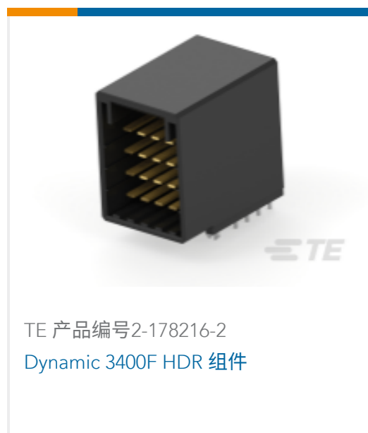
TE 产品编号 2-178216-2 Dynamic 3400F HDR 组件