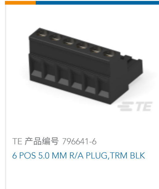
TE 产品编号 796641-6 6 POS 5.0 MM R/A PLUG, TRM BLK