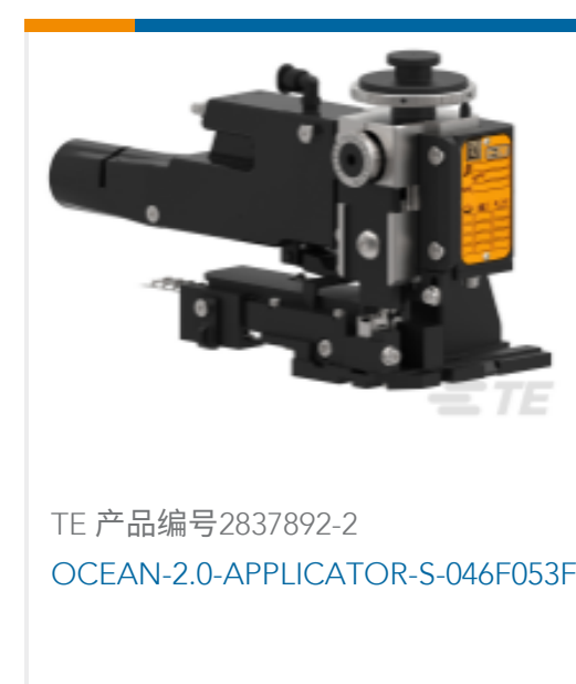
TE 产品编号 2837892-2 OCEAN-2.0-APPLICATOR-S-046F053F