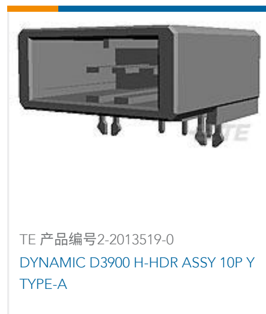
TE 产品编号 2-2013519-0 DYNAMIC D3900 H-HDR ASSY 10P Y TYPE-A