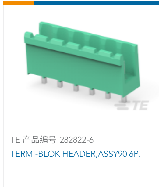
TE 产品编号 282822-6 TERMI-BLOK HEADER, ASSY 90 6P.