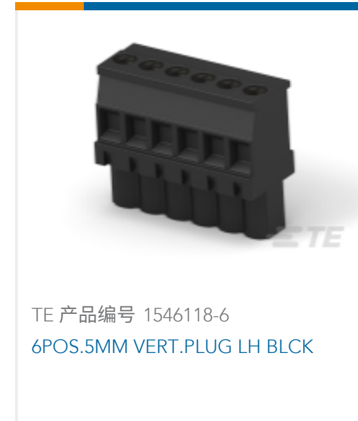
TE 产品编号 1546118-6 6 POS. 5MM VERT. PLUG LH BLCK