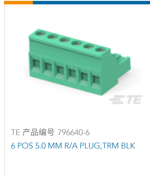
TE 产品编号 796640-6 6 POS 5.0 MM R/A PLUG, TRM BLK