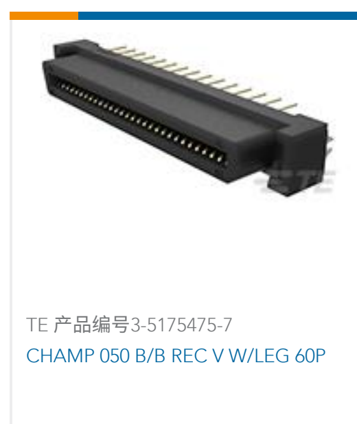
TE 产品编号 3-5175475-7 CHAMP 050 B/B REC V W/LEG 60P