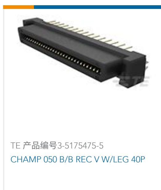
TE 产品编号 3-5175475-5 CHAMP 050 B/B REC V W/LEG 40P