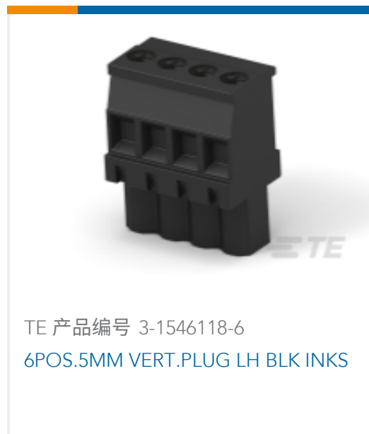
TE 产品编号 3-1546118-6 6 POS. 5MM VERT. PLUG LH BLK INKS