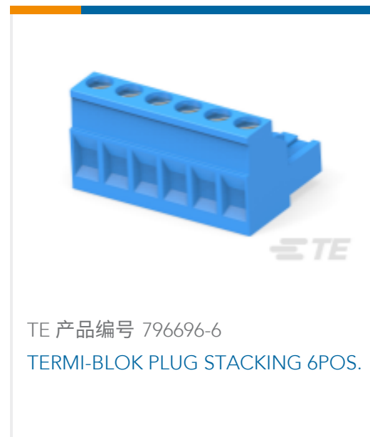
TE 产品编号 796696-6 TERMI-BLOK PLUG STACKING 6 POS.