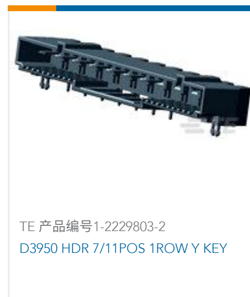
TE 产品编号 1-2229803-2 D3950 HDR 7/11 POS 1 ROW Y KEY