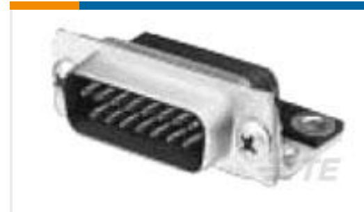
TE 产品编号5745435-8 15 PLUG RA/MS 454