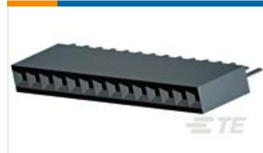
TE 产品编号6-534237-2 14 MODII VRT SR CE 100/115