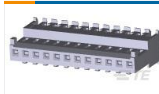
TE 产品编号4-644565-2 12P MTA100 CONN ASSY F/T 28AWG