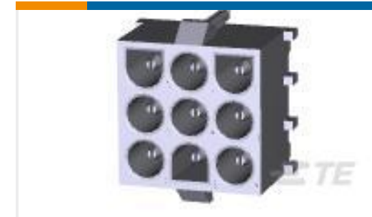
TE 产品编号641972-3 09P UMNL PIN HDR ASSY 94VO LF