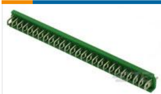
TE 产品编号5164713-7 07P.MINI-MATCH ASSY