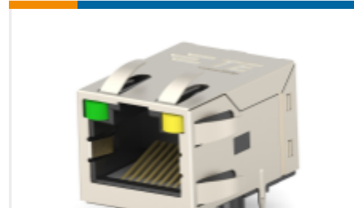
TE 产品编号5-2337992-3 RJ45 JACK MAG. POE 10/100 LED 1X1 INV.