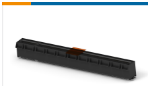
TE 产品编号 5-2337939-4 PCIE GEN4 CON,SMT,164POS,30u", MYLAR,HT