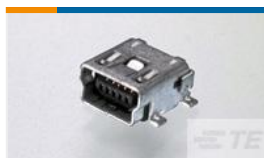
TE 产品编号1-1734035-2 MINI USB, TYPE B, R/A, SMT