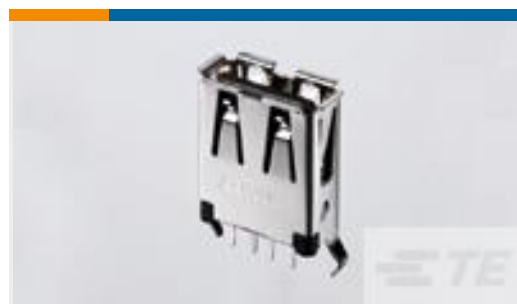
TE 产品编号1734366-3 Std USB Type A, VT, T/H, Blue