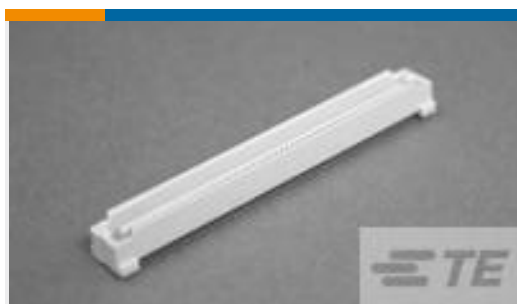
TE 产品编号5177984-6 0.8FH,P05H.5,140,08/Sn,TU