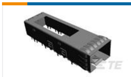
TE 产品编号2110304-1 SFP+ 1x1 Cage Assembly, Solder Tail