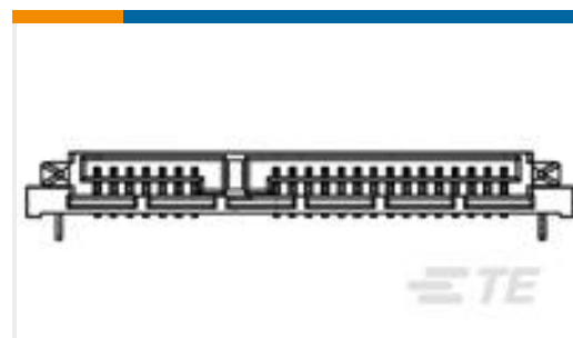
TE 产品编号2023246-2 ASS'Y SATA REC. R/A SMT TYPE 3.45H