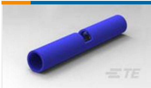
TE 产品编号320562 SPLICE BUTT PIDG 16-14