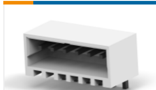
TE 产品编号5-1775443-2 AMP HPI 1.5 mm Headers