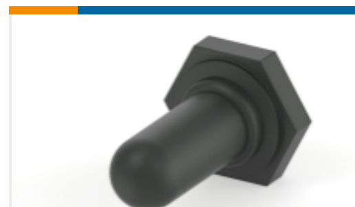
TE 产品编号1825609-1 B1048004=Boot,Toggle