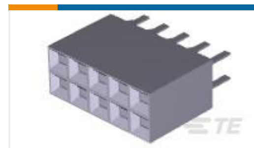
TE 产品编号534206-5 10 MODII VRT DR CE 100/115