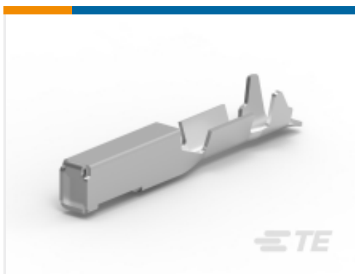
TE 产品编号2035334-7 Contact, female0.64 ,0.13sqmm,