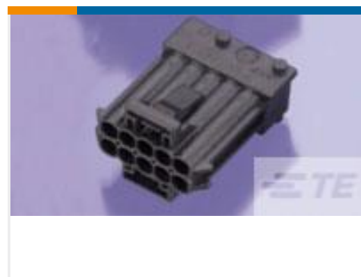
TE 产品编号1-962375-1 2P MESSERLEIS-GEH