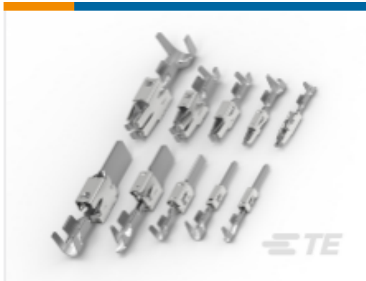
TE 产品编号929937-6 定时器, 母端和公端