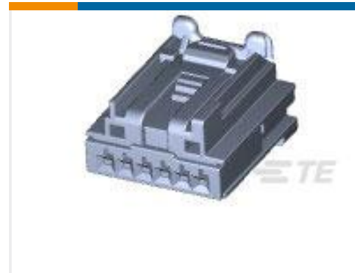
TE 产品编号2035363-2 1X6 GENERATION Y ASSY KEYB CPA