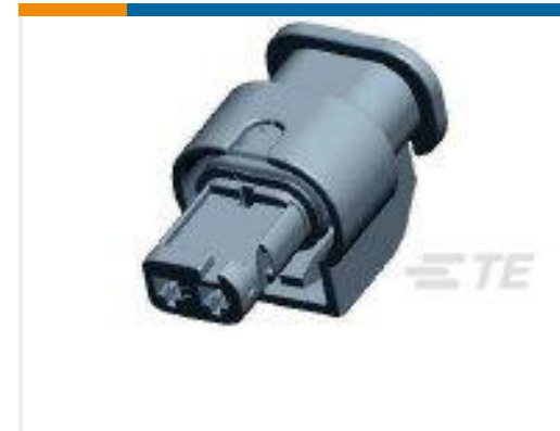
TE 产品编号1-1670915-1 2POS, MCON 1.2 LL REC SEALED