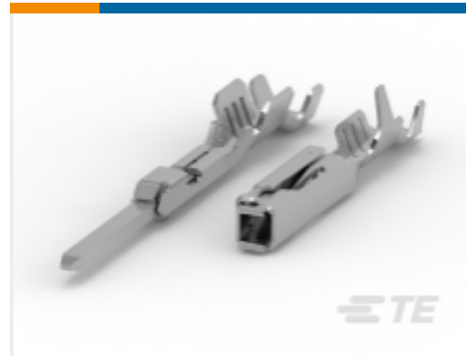
TE 产品编号1-1419158-6 GET .64 连接器系统, 母端和公端