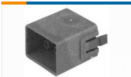
TE 产品编号1103017-1 MDL2.HN.D.15.STI.C