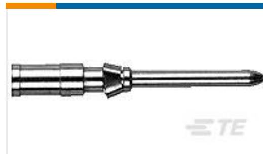
TE 产品编号4-1105050-2 HN.D-C-STI.AU.1.5