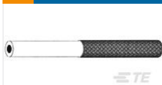
TE 产品编号F670223001 RAY-90-10.0(100)