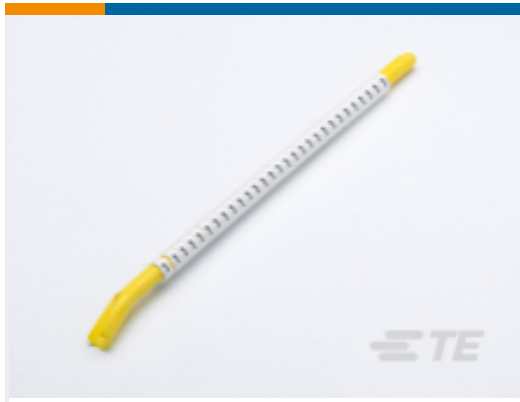
TE 产品编号7-1768045-7 STD Snap-On Markers