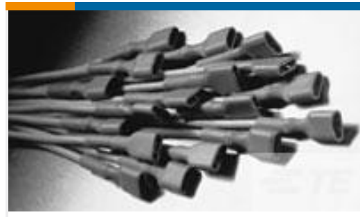
TE 产品编号9097614001 LSTT-4.8-0-SP