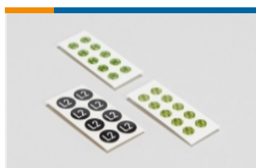
安全符号和电气符号(44)