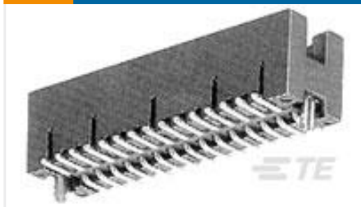
TE 产品编号104655-7 60 50/50 HDR DRST SFMNT .250