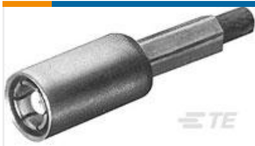
TE 产品编号5414946-2 PLUG, CBL, STR, SMB, PB FREE