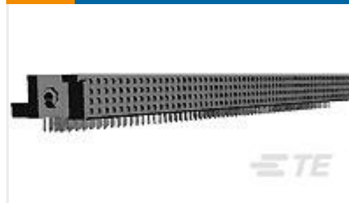
TE 产品编号532434-8 HDI RECP ASSY 4 ROW 220 POS