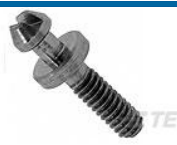
TE 产品编号787003-3 .8MM LATCHING POST,BRDMT,BULK