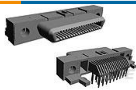
TE 产品编号5787973-1 36 .8MM CHAMP RCPT ASSY