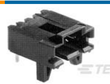
TE 产品编号1-103673-9 20 MTE HDR SRRA LATCH W/HLDWN