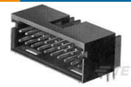
TE 产品编号5-103167-3 12 MODII HDR DRRA SHRD LF