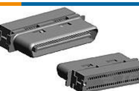
TE 产品编号5787131-2 36 .8MM CHAMP PLUG KIT